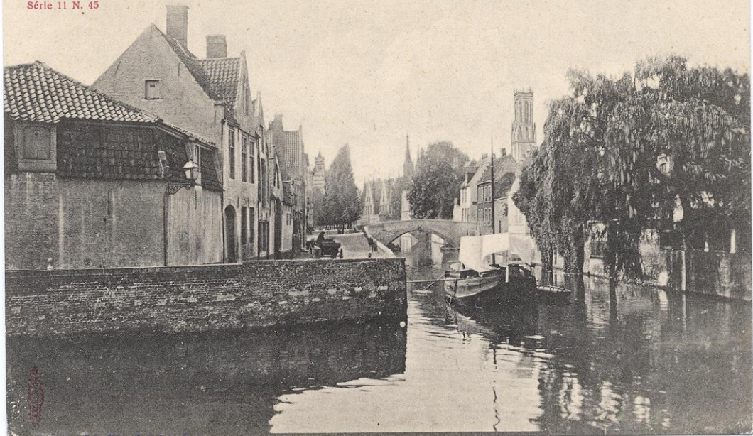
BRUGES. - Le Qual Vert Série 11 N. 45