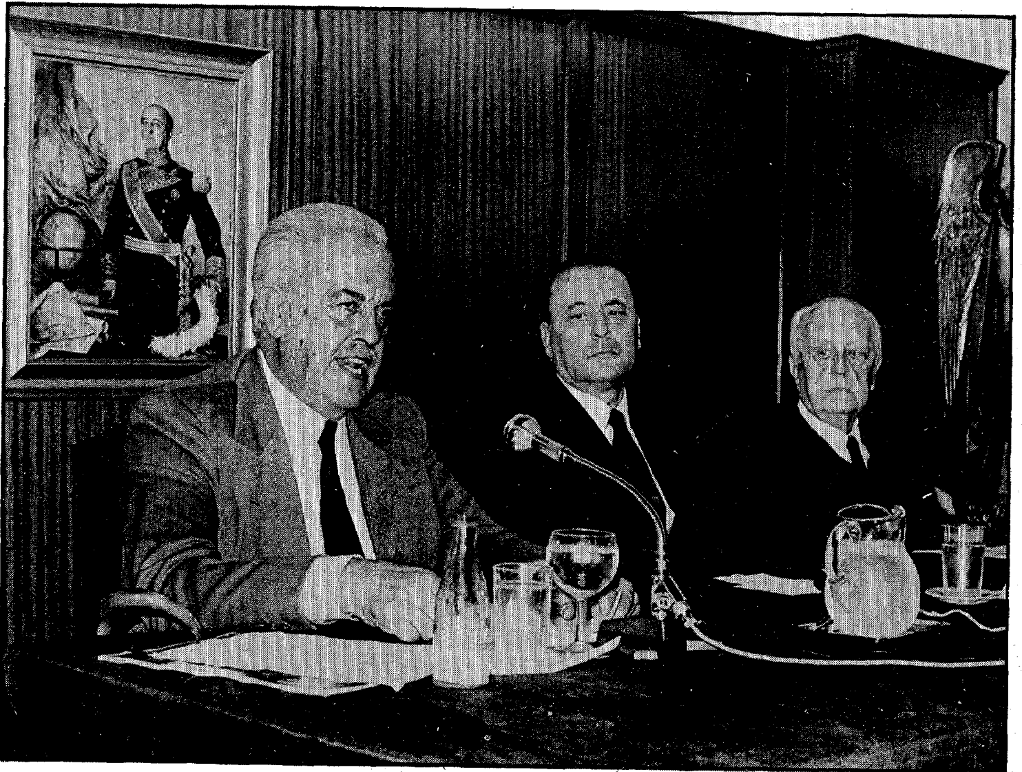
Conferencia de José Antonio Girón de Velasco en el Aula "Fuerza Nueva"

España prosperó porque el Caudillo le dio paz a la Patria y exigió trabajo a los españoles