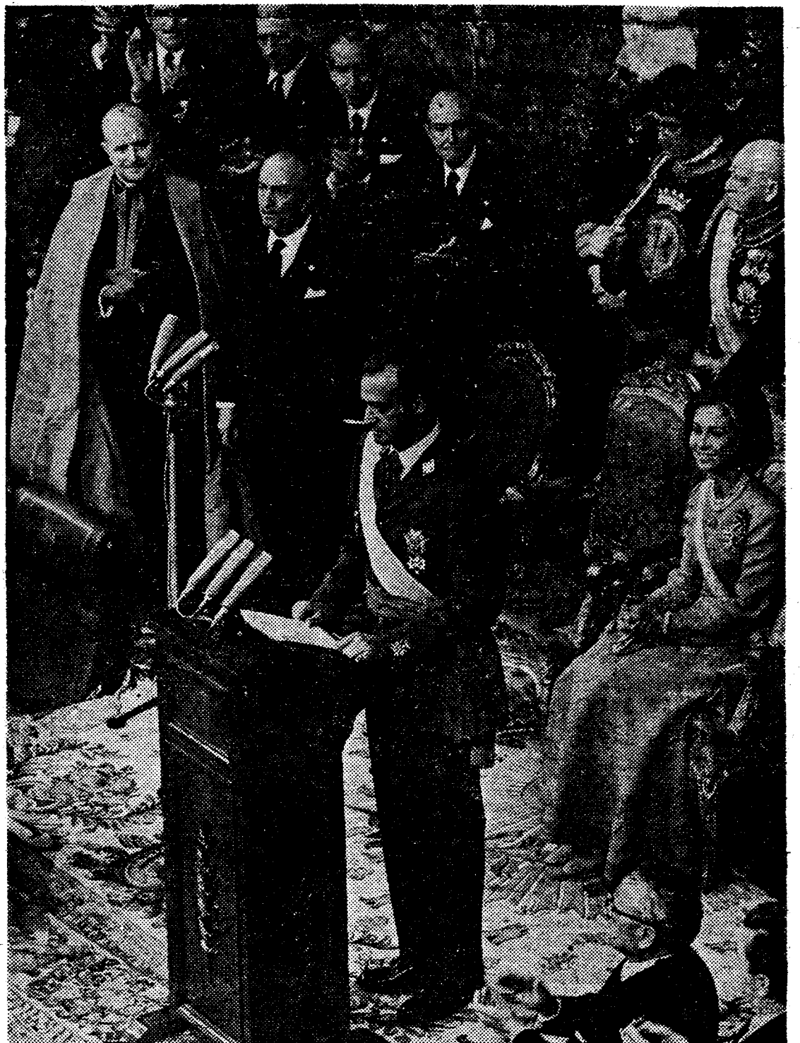
Interrumpen con sus aplausos el mensaje de la Corona.

Si todos permanecemos unidos, habremos ganado el futuro. ¡Viva España!