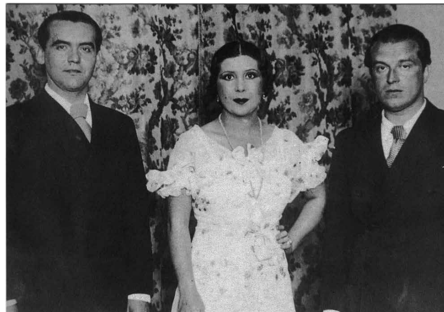
Encarnación López Júlvez, “La Argentinita”, junto con Federico García Lorca y Rafael Alberti, 1934