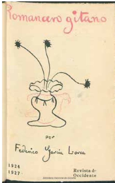
Portada de Primer Romancero gitano , 1924-1927, de Federico García Lorca. Madrid, Revista de Occidente , 1928