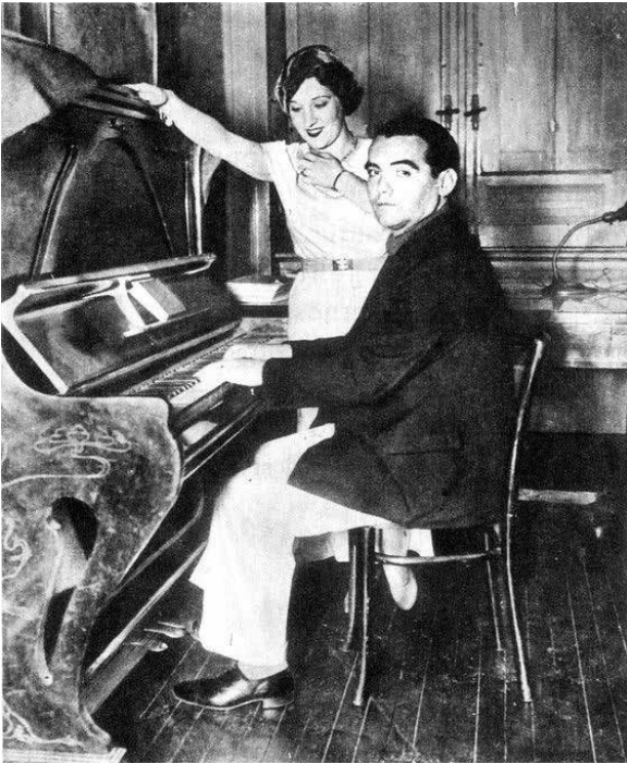
Fotografía de Federico García Lorca y "La Argentinita"

con el traje típico de Candelario. Sus melodías asequibles y la mitificación de Lorca tras su trágica muerte han facilitado la pervivencia de este repertorio, explotado hasta la saciedad.