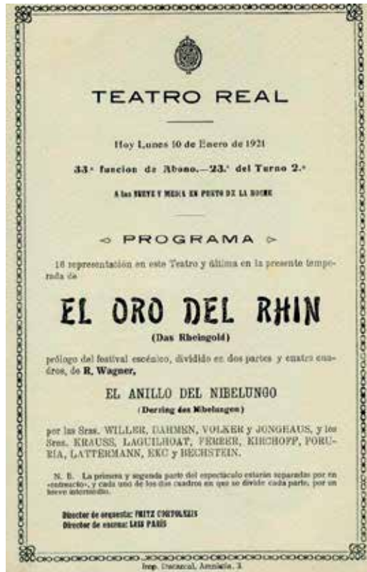
Programa de El oro del Rhin de Richard Wagner en el Teatro Real de Madrid, 10 de enero de 1921

renunció a deleitarse con esa otra forma de modernidad ofrecida por la música urbana, como las sonoridades novedosas de la jazz-band que triunfaban en bares, tertulias y locales de ocio nocturnos. Todo un equilibrio de tendencias contrapuestas que configuraron la propia identidad del artista.