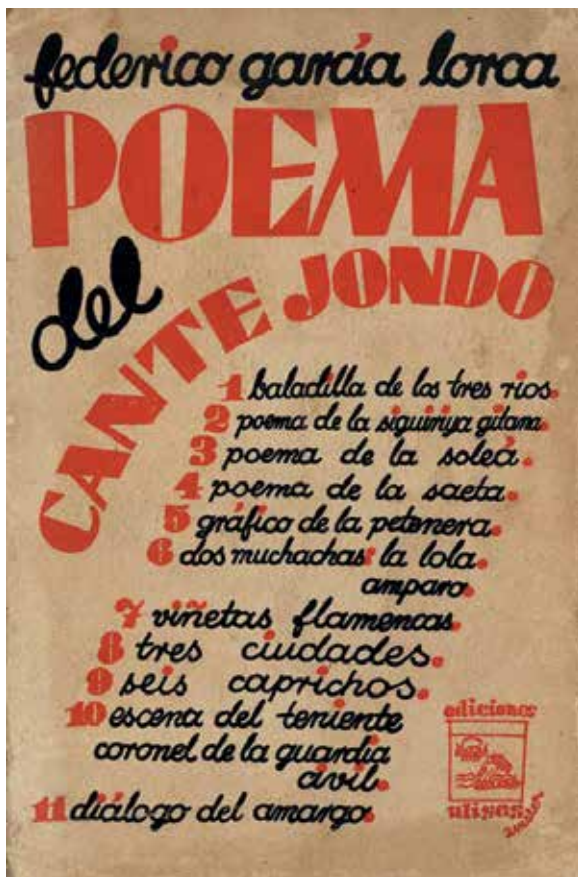
Cubierta del Poema del cante jondo de Federico García Lorca. Madrid, Ediciones Ulises, 1931

las costumbres y los bailes regionales. La introducción de este repertorio inmortalizado por Lorca se aprecia sobre todo a partir de los años sesenta –mentar al poeta desde el régimen que lo asesinó requería dejar reposar el cadáver un tiempo prudencial–, en películas como Café de chinitas (1960) o La nueva cenicienta (1964). La primera narra la biografía fantaseada de un cantante, lo que sirve de pretexto para exhibir quince números flamencos interpretados por sus protagonistas (Antonio Molina y Rafael Farina,