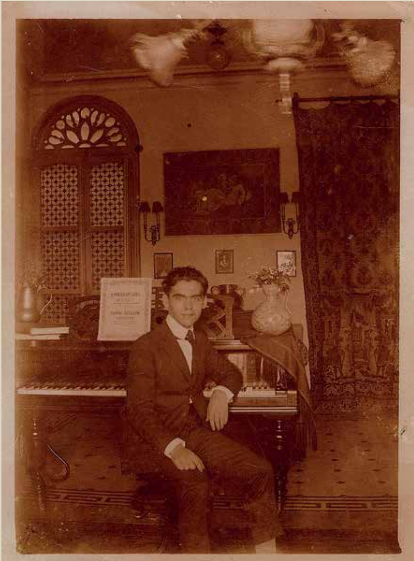
Federico ante su piano en la casa de la Acera del Casino.