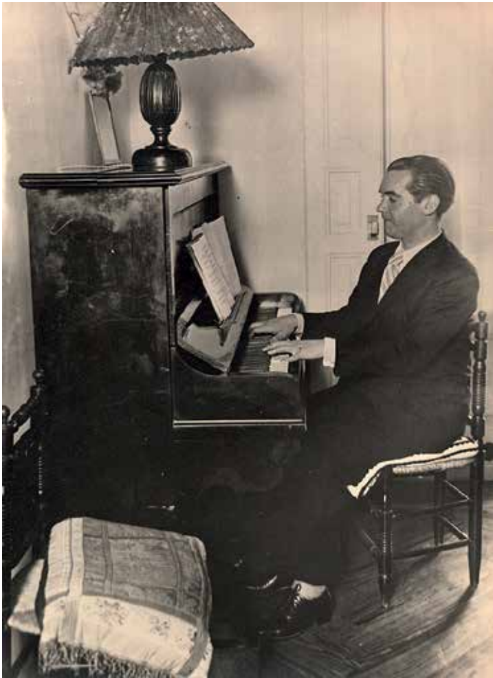
Lorca tocando el piano.