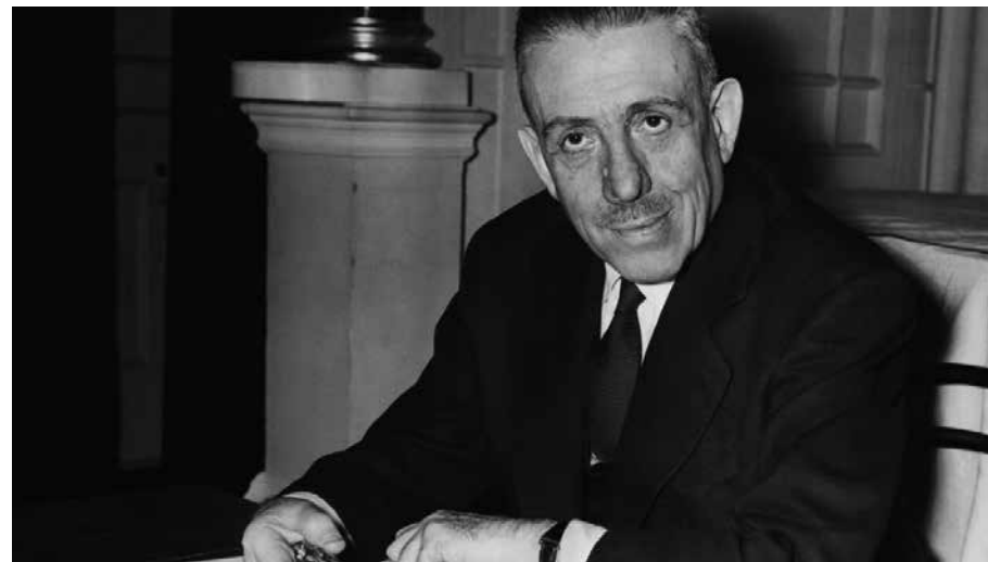
Francis Poulenc en 1958.