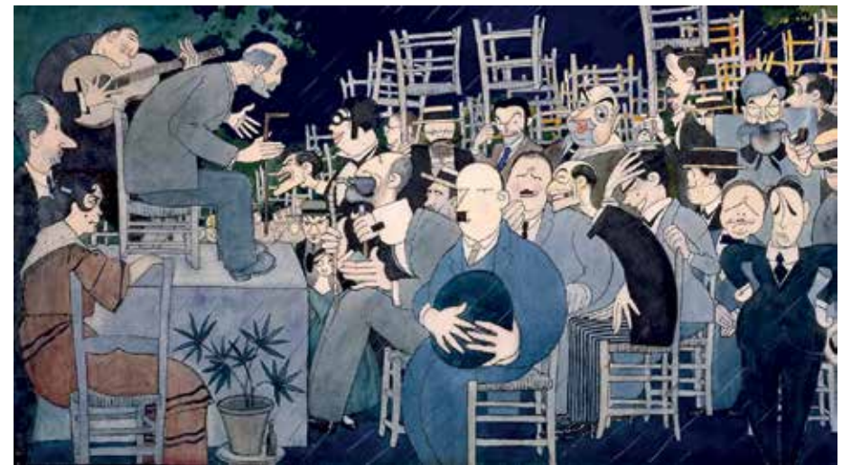
Caricatura de Antonio López Sancho para la crónica publicada en el diario ABC sobre el Concurso de Cante Jondo (Granada, junio de 1922)

Durante este segundo período de la dictadura, las melodías lorquianas entraron en un proceso de normalización, lo que facilitó su consumo desde diferentes escenas musicales. De este modo, Los