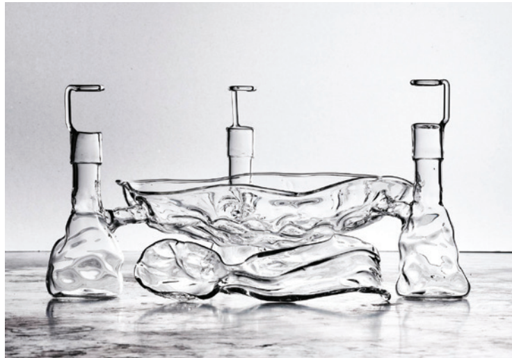
The Melting Bowl [El cuenco fundiéndose], obra de Marta Armengol para Camper