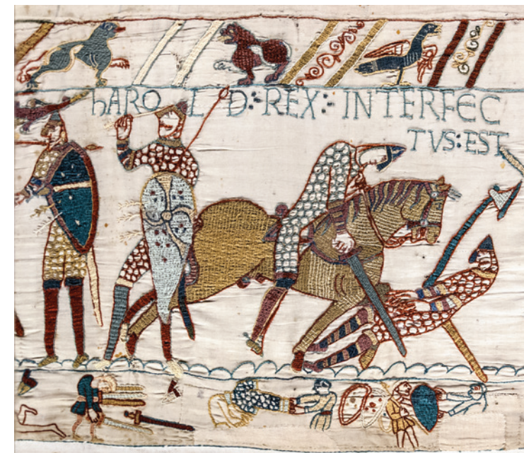
Fragmento del tapiz de Bayeux, que relata la batalla de Hastings, creado entre 1082 y 1096. La Tapisserie de Bayeux, Calvados, Francia