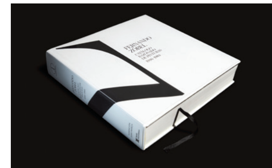
Ejemplar del Catálogo razonado de pinturas de Fernando Zóbel

La Fundación Azcona presentará –en paralelo a la celebración de la exposición Zóbel. El futuro del pasado en el Museo Nacional del Prado– el Catálogo razonado de pinturas de Fernando Zóbel . La edición de la obra no habría sido posible sin