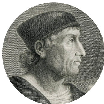
Søren Kierkegaard, Thomas Hobbes y Antonio de Nebrija, protagonistas de tres ciclos de conferencias acerca de sus vidas, sus obras y su tiempo