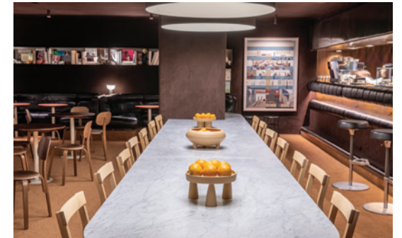
El nuevo Café de la March