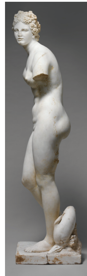
Copia de una estatua griega del siglo III o II a. C. de la diosa Afroditá, siglo I o II d. C. Metropolitan Museum of Art, Nueva York