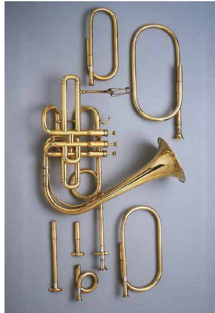
Cornet à pistons en Si bemol de 1845–50 construido por Auguste Raoux. Gallery 680, The Met Fifth Avenue, 2018.

nuevo repertorio, fue fundamental para establecer definitivamente el quinteto de metales como una agrupación camerística consagrada y con una extensa literatura propia. Y esto ayudó, por consiguiente, a que se estableciera también en los conservatorios, erigiéndose en una de las formaciones habituales para la práctica de música de cámara entre los alumnos de estos instrumentos.