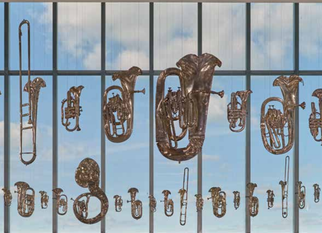
Exposición Perpetual Canon , de Cornelia Parker, integrada por sesenta instrumentos aplastados, suspendidos del techo mediante cables, que en su día pertenecieron a grupos de viento-metal. Turner Contemporary's Sunley Gallery, Margate, 2018.

El programa que ha escogido Spanish Brass para este concierto no es tan solo un muestrario de los diferentes estilos que los compositores jóvenes están cultivando al escribir para quinteto de metales. Es también, y particularmente, una ventana abierta a las nuevas voces que están surgiendo en el este de la península ibérica, ya que cinco de las siete obras pertenecen a autores nacidos en la Comunidad Valenciana y en Cataluña, zonas geográficas que, por otra parte, cuentan con un rico acervo de bandas y coblas en las que los instrumentos de viento constituyen el tejido principal.