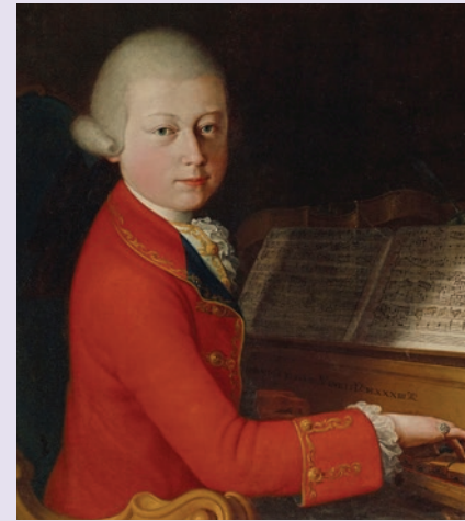
Mozart hacia 1770, retrato atribuido a Giambettino Cignaroli

En negrita las obras interpretadas en el ciclo