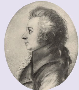
Mozart retratado por Dora Stock en una visita a Dresden en 1789

Nace su quinta hija, Anna Maria, fallecida ese mismo año. La situación económica empeora y solita ayuda a hermanos masones. Compone Così fan tutte , la Giga en Sol mayor KV 574 y posiblemente el Minueto en Re mayor KV 355 .