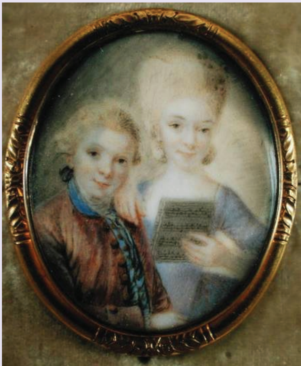
Eusebius Johann Alphen, Wolfgang y Nannerl , miniatura sobre marfil, c. 1765 (Salzburgo, Internationale Stiftung Mozarteum).

La primera interpretación pública a cuatro manos de los hermanos Mozart que ha podido documentarse tuvo lugar en Londres en 1765.