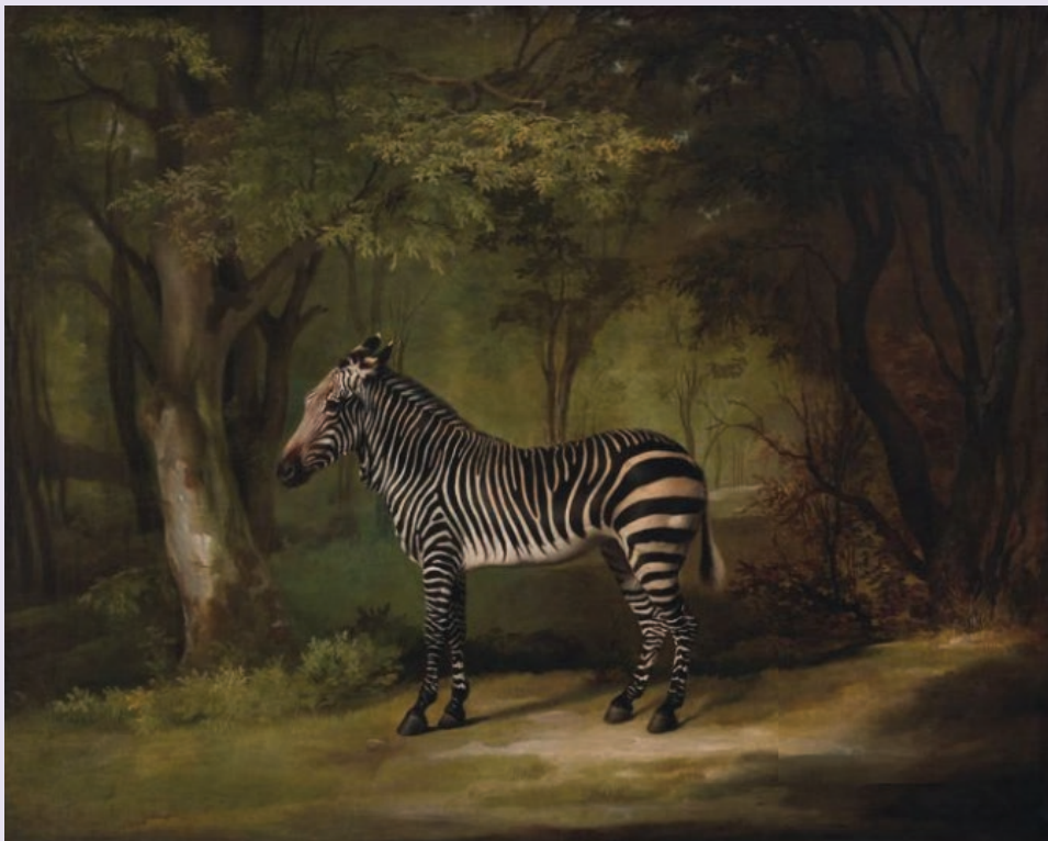
George Stubbs, La primera cebra vista en Inglaterra , óleo sobre lienzo, c. 1763 (New Haven, Yale Center for British Art, Paul Mellon Collection)

La cebra representada por George Stubbs llegó a Inglaterra procedente de Sudáfrica en 1762. Se trataba de un regalo a la reina Carlota, discípula de Johann Christian Bach y a quien el pequeño Wolfgang dedicó sus seis Sonatas KV 10-KV 15 . El animal, que despertó una enorme curiosidad en Londres, fue visitado por los Mozart.