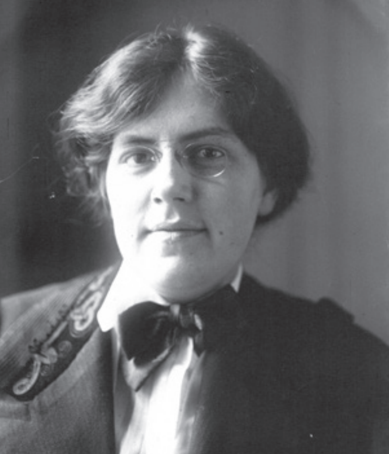
Nadia Boulanger. Fotografía de la agencia de prensa Meurisse, 1913. Biblioteca Nacional de Francia

Boulanger, era capaz de escuchar de otra manera las obras conocidas, como si antes solo se hubiera quedado en la superficie. El oído de Nadia Boulanger era legendario. No solo corregía en el papel, sino que era capaz de detectar lo que no funcionaba en una primera audición. Y en un mundo de tantos estilos y músicas posibles aprender esa coherencia era un bien codiciado. Nadia era como un timón del que fiarse en el remolino de estilos circundantes.