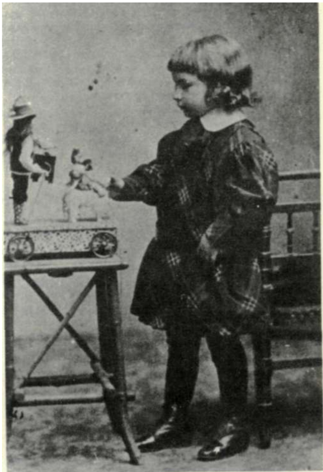
Joaquín Rodrigo, niño, en Valencia.