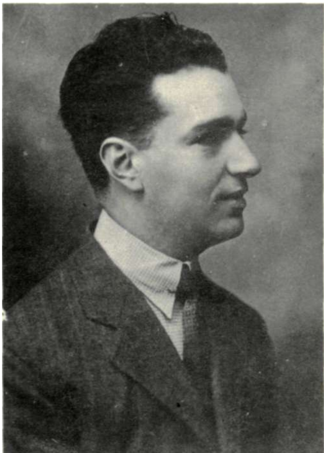
Joaquín Rodrigo en 1921