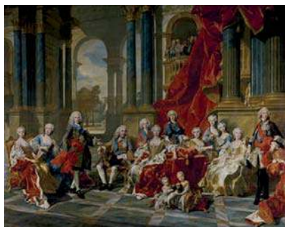
Louis-Michel van Loo. La Familia de Felipe V . Museo del Prado, Madrid, 1743.