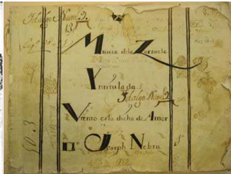
Portada del libreto de la zarzuela Cautelas contra cautelas y el rpto de Ganímedes (BN T/10539) y de la partitura de la zarzuela Viento es la dicha de Amor (Biblioteca Municipal de Madrid Mus 50-3), compuestas por José de Nebra.

lipe Falconi y Giacomo Facco—, sino que se integraba de lleno en la tradición de la ópera seria con el recitativo y el aria da capo como señas de identidad indiscutibles.