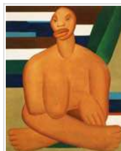
Tarsila do Amaral A Negra, 1923

Primera exposición individual dedicada en España a Tarsila do Amaral (Capivari, Sao Paulo, 1886 – Sao Paulo, 1973), figura emblemática de la pintura en Brasil e introductora de las vanguardias europeas en su país.