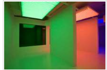
Carlos Cruz-Diez Cromosaturación , 2009