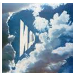
Eric Bulátov ¡Voy!, 1975