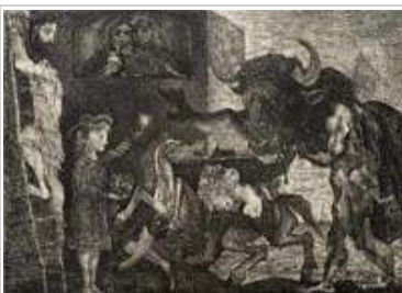
Pablo Picasso Minotauromaquia , 1935