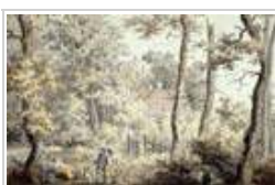
Caspar David Friedrich, Casa de campo en el bosque, 1797