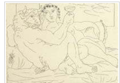
Pablo Picasso Minotauro con una copa en la mano y mujer joven , 1933

El Museo expone una selección de la obra gráfica de Pablo Picasso perteneciente a su colección: 100 grabados de la Suite Vollard , otros 28, fechados entre 1904 y 1915, con estampas de sus etapas azul y rosa y de su época cubista, 1909- 1915.