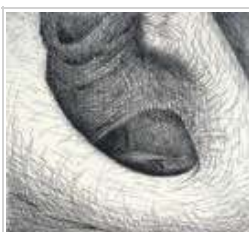
Henry Moore Lámina de la carpeta Elephant Skull, 1970