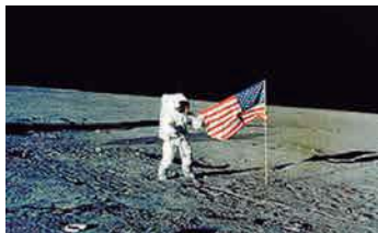
Expedición a la Luna, 1969