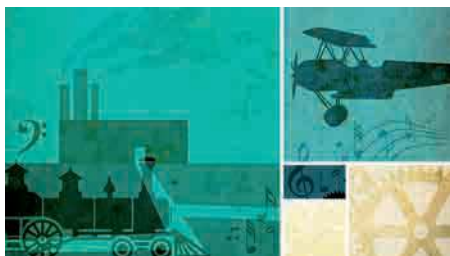
Futurismo y máquinas

En las mañanas de los sábados, los días 4, 11, 18 y 25 de octubre y 1 de noviembre, se presenta el ciclo Música hipnótica: chaconas y folías , un exitoso tipo de composición repetitiva que produce en el oyente una cierta sensación hipnótica. Y en noviembre, como ya es tradicional en la Fundación Juan March, en las mañanas de los sábados (y también en dos casos, repetición por la tarde) jazz o blues: blues en esta temporada. Los