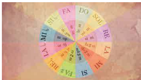
Preludios y fugas