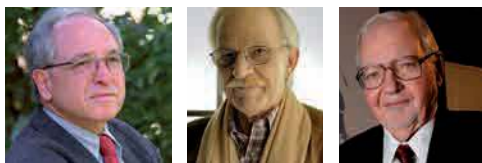
José Álvarez Junco, Antonio Escohotado y Fredric Jameson