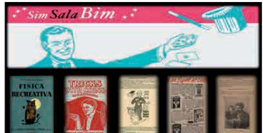
Portal de la Biblioteca digital de Ilusionismo

Al finalizar la temporada destacan la visita virtual a la “Biblioteca personal de Julio Cortázar”, aproximando a los interesados el universo cultural del que se envolvía el escritor argentino y contribuyendo también al centenario de su nacimiento; la actualización y ampliación de la “Biblioteca digital de Ilusionismo” con títulos entre 1733 y 1939; y el portal digital “Todos los catálogos de arte desde 1973” de las exposiciones organizadas por la Fundación.