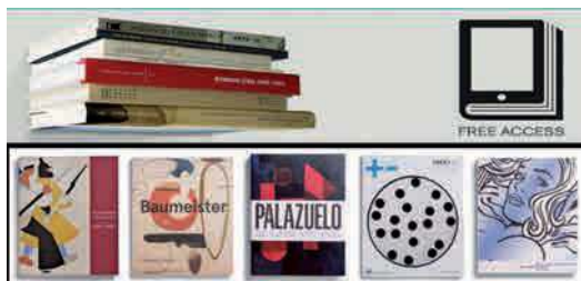
Portal digital Todos los catálogos de arte desde 1973

Durante la temporada, por consiguiente, la Biblioteca ha ampliado sus funciones y a la vez ha profundizado en las que ya le son intrínsecas, innovando nuevos ejes y formas de trabajo para cumplir sus objetivos con los investigadores y con la propia organización. ♦