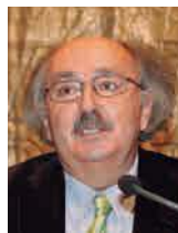
Ramón Tamames, Cristina García Rodero y Antonio Colinas