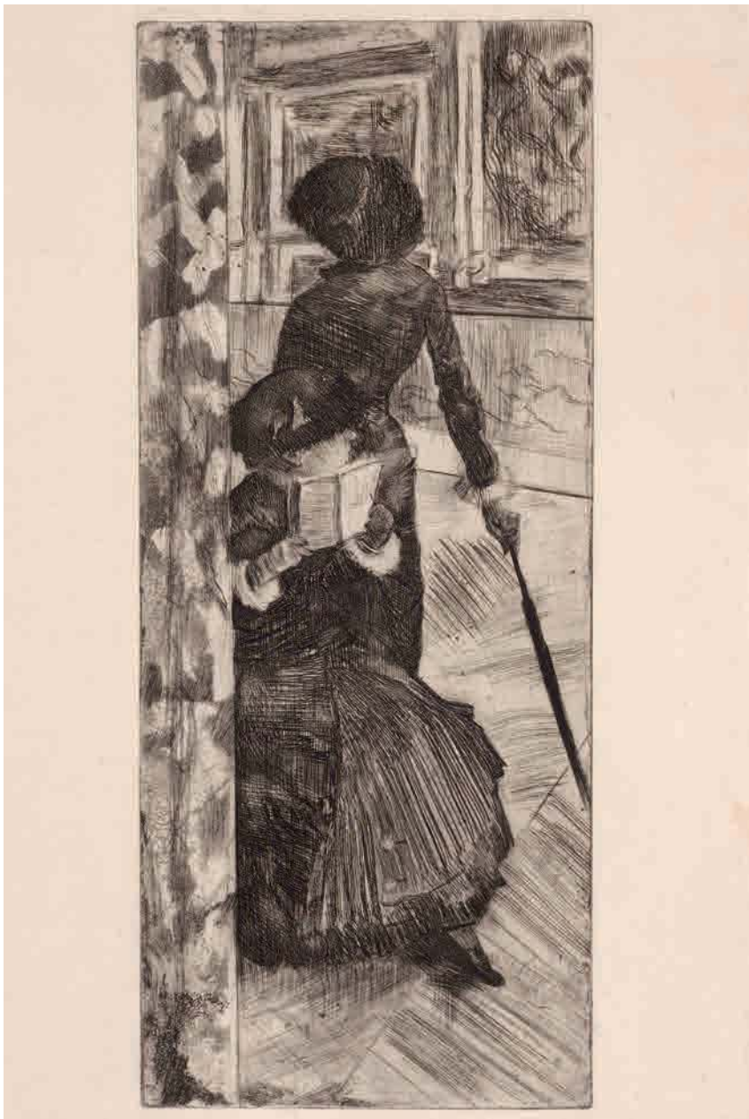
Mary Cassatt en el Louvre: la Galería de Pinturas , 1879-80, inventado y grabado por Edgar Degas.

Grabado calcográfico: barniz blando, concluido con aguainta y punta seca, 305 x 126 mm.