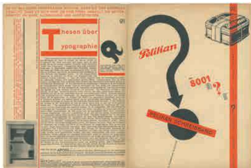
Derecha: Kurt Schwitters, Merz, no. 11. Tipoanuncio, 1924. Archivo Lafuente. Izquierda: Kurt Schwitters, La Catedral. Hannover: Paul Steegemann Verlag, 1920. Colección Merrill C. Berman.

el modelo “económico” o “empresarial” del trabajo de Schwitters como diseñador gráfico no fue ni mucho menos algo ajeno a su conciencia de artista y poeta. La exposición Kurt Schwitters. Vanguardia y publicidad quiere mostrar visualmente el trabajo artístico y tipográfico de Schwitters como un todo comprensible, regido por una peculiar lógica interna: el collage permitió a Schwitters restablecer y recomponer un orden –el orden del arte y la poesía– para aquellas cosas del mundo y la vida cotidiana –entradas de teatro, envoltorios usados y rotos, papeles de periódico, trozos de tela, alambres, clavos, pero también textos, palabras inconexas, expresiones, poemas, frases y sílabas– a las que el paso del tiempo y el propio uso habían despojado de su sentido y su función primigenios. Además, la sensibilidad poética de Schwitters, tan presente en sus collages, aparece también en su trabajo como diseñador publicitario, en el que con frecuencia aplicó un ingenio poco común para crear frases y slogans muy eficaces, algunos de los cuales acabarían haciéndose muy populares.