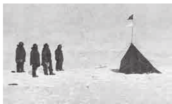
Expedición Amundsen en el Polo Sur, 1911