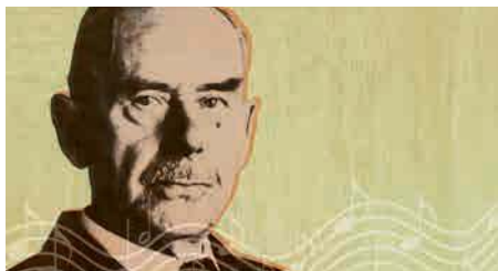
El universo musical de Thomas Mann

Una vez al mes, de octubre a mayo, en las tardes de los viernes, y con repetición en las de los sábados, tienen lugar los “Viernes