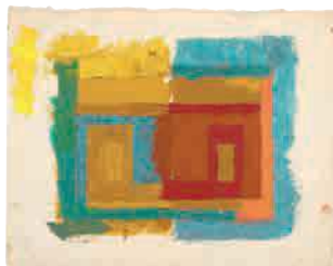
Josef Albers, Estudio para una Variante, c 1947. The Josef and Anni Albers Foundation.

Josef Albers (1888-1976), más célebre hoy por sus vínculos con la Bauhaus (en la que fue alumno y maestro entre 1920 y 1933) y por sus pinturas al óleo de la serie Homenaje al cuadrado (1950-76) que por su obra gráfica, fue un creador de obra gráfica durante toda su vida. Desde los austeros