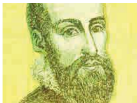
Garcilaso de la Vega