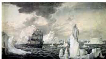
Expedición científica Malaspina, siglo XVIII