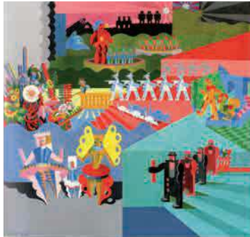
Fortunato Depero, I Mie Balli Pastici , 1918. Colección particular

La obra de Depero, fronterizo entre los pioneros y los continuadores de la estética y la poética futurista, apenas ha sido expuesta fuera de Italia (y solo en un par de ocasiones en exposiciones individuales), pero ha experimentado una reevaluación en el curso de las últimas décadas en el campo de los estudios sobre el fu-