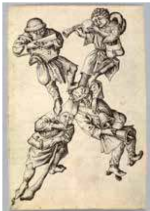
Maestro E. S., Letra X (músicos mendicantes) , c. 1435-67, Germanisches Nationalmuseum, Núremberg

Una selección de cerca de 200 dibujos, grabados, fotografías, libros y revistas exhibe la exposición Surrealistas antes del surrealismo , que presenta la Fundación Juan March en Madrid. Comisariada por Yasmin Doosry y organizada en colaboración con el Germanisches Nationalmuseum de Núremberg, la muestra abarca desde el Medievo tardío hasta el propio surrealismo del siglo XX.