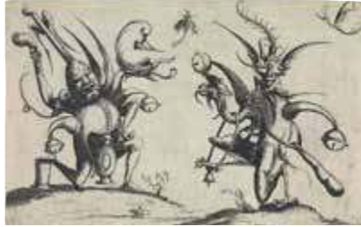
Pierre Jahan, Sin título, 1937 (Colección Dietmar Siegert) (izquierda) y Wendel Dietterlin el Joven, Figuras ornamentales fantásticas , 1615 (Germanisches Nationalmuseum, Núremberg)