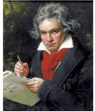
Joseph Karl Stieler: Retrato de Ludwig van Beethoven componiendo la Misa Solemnis , 1820. Bonn, Beethoven-Haus.

por Johann Nepomuk Hummel (1778-1837), con quien Beethoven mantendría discrepancias motivadas por su desacuerdo con algunas versiones camerísticas de sus sinfonías. Pero la pujanza de la industria editorial y la capacidad de los arreglos para difundir las creaciones musicales impulsarían a Beethoven a rea-