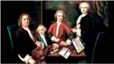
Johan Sebastian Bach con sus hijos Gottfried Heinrich, Carl Philipp Emmanuel y Wilhelm Friedemann (?) de artista desconocido.

MIEMBROS DE LA SAGA BACH CUYAS OBRAS SE INTERPRETAN EN ESTE CICLO: