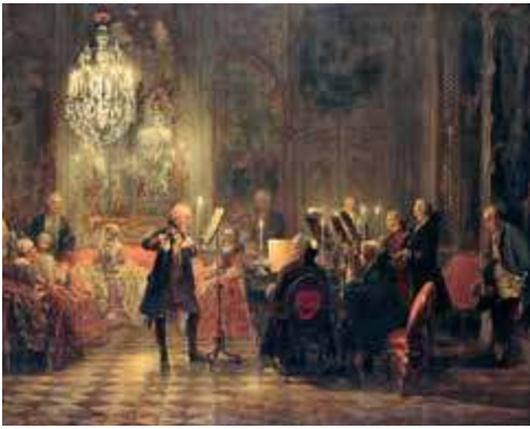
Carl Philipp Emanuel Bach con Federico el Grande. El concierto de flauta en Sanssouci , de Adolph von Menzel (óleo sobre lienzo, 1848). Alte Nationalgalerie, Berlín.