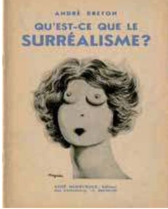
Portada del libro ¿Qué es el surrealismo? , de André Breton (1934)