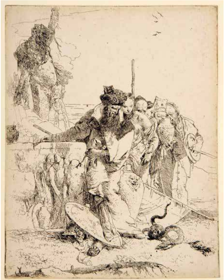
El mago y la serpiente , ca. 1743-50, de Giambattista Tiepolo. Grabado calcográfico, aguafuerte, 227 x 178 mm. Firmado sobre el cobre. En la esquina inferior izquierda de la estampa, invertido: Tiepolo. Harvard Art Museums / Fogg Museum, Loan from the Collection of Edouard Sandoz, 11.1965.