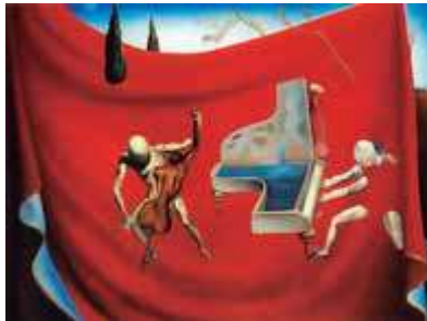
Salvador Dalí, La orquesta roja , 1957 Collection G.E.D: Nahmad, Geneve