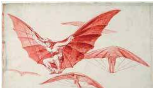
Francisco de Goya, Modo de volar . Dibujo preparatorio de la serie Disparates . Fundación Lázaro Galdiano, Madrid.

¿Qué conexión existe entre Man Ray y Alberto Durero? En este interrogante podría resumirse la cuestión que plantea esta muestra. La pregunta parece, en un primer momento, tan sorprendente como el “encuentro fortuito de una máquina de coser y un paraguas sobre una mesa de disección”. En 1920, antes de su llegada a París, el fotógrafo americano Man Ray creó L'Enigme d'Isidore Ducasse [El enigma de Isidore Ducasse]. En su principal obra literaria, Les Chants de Maldoror , del año 1868, Lautréamont (seudónimo de Isidore Ducasse) alababa la inusual belleza de un joven sirviéndose de una asombrosa comparación: “bello como el encuentro fortuito de una máquina de coser y un paraguas sobre una mesa de disección”. Esta metáfora absurda y contradictoria, que posee un matiz erótico, frío y distante, fue recibida por los surrealistas