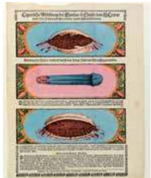
Johan Philipp Stendner, Las llagas de Cristo , c. 1680. Germanisches Nationalmuseum, Núremberg