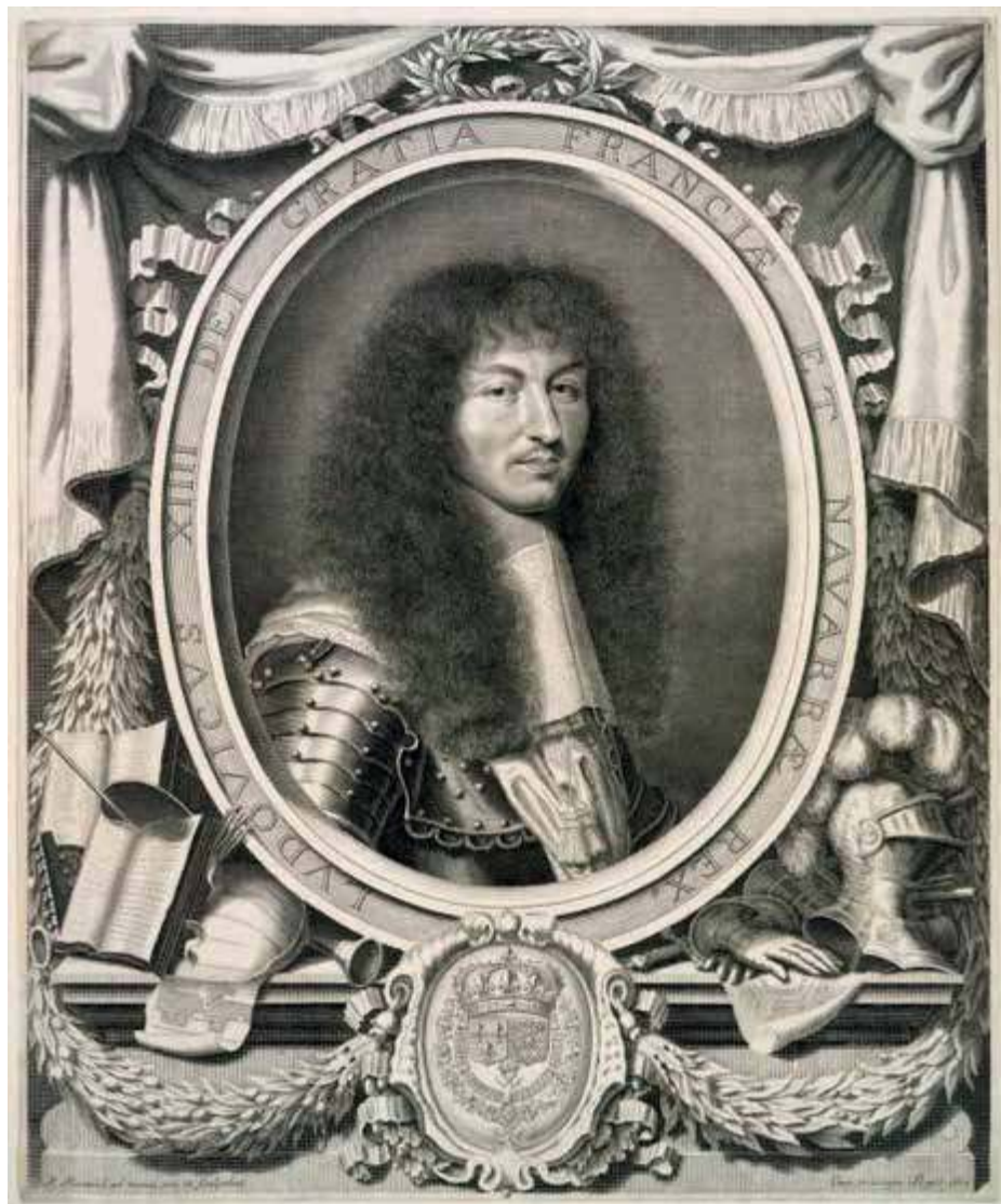
Retrato de Luis XIV, rey de Francia, 1663. Pintado y grabado por Robert Nanteuil. Grabado calcográfico, talla dulce (buril) 403 x 331 mm. Princeton University Library, Department of Rare Books and Special Collections, Graphic Arts, GC016 Robert Nanteuil Collection, GA 2005.01126.