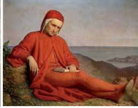
Dante Alighieri y el universo de la Divina Comedia representados por Domenico di Michelino en la catedral de Florencia (izquierda).