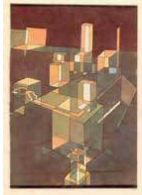
Ciudad italiana, 1928

En torno a 1930 llama la atención la aparición de muchas construcciones geométricas en los cuadros de Paul Klee. Están vinculadas con la configuración planimétrica y estereométrica que empezó a enseñar en la Bauhaus a partir de 1927. Hay algunos dibujos que son, en mayor o menor medida,