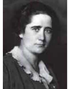
Alma Mahler, Virginia Woolf y Clara Campoamor

solamente una exquisita modernista, creadora de belleza en sus novelas y cuentos; es también una pensadora, cuyas reflexiones sobre el arte —la relación de la creación con las condiciones materiales, los límites de la representación, las mujeres como objeto y sujeto de la literatura...— están del todo vigentes. Al mismo tiempo, y ése es el otro motivo que explica su actualidad, Woolf es un icono muy poderoso (por su fama y su sólido prestigio), pero también ambiguo. ¿Escritora elitista o autora popular? ¿Defensora de la tradición o vanguardista? ¿Artista encerrada en su torre de marfil, o intelectual comprometida? ¿Casta esposa victoriana, u homosexual?... Ninguna de estas preguntas tiene una respuesta clara, lo que ha permitido a los más diversos grupos reivindicar a Woolf. Y así es como el exquisito jardín modernista en el que florecen obras tan refinadas como Al faro , Orlando o Las olas es también un fértil huerto que acoge textos robustos — El señor Bennett y la señora Brown , Una habitación propia , Tres guineas ...— y, a la vez, un campo de batalla en el que se afrontan muy distintas causas”.