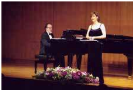
Los compositores Hanns Eisler y Arnold Schoenberg y los intérpretes del concierto