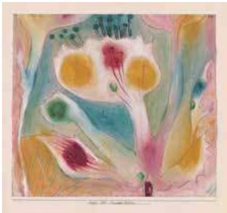
Flor tropical, 1920

Paul Klee convirtió muy pronto las leyes de la naturaleza en el fundamento de su quehacer artístico. Mientras que en las clases la naturaleza sirve como ejemplo ilustrativo de una configuración viva, en su actividad creadora le interesa también como motivo. Fascinado por la visión a través del microscopio crea cuadros con formas de tipo celular o tematiza incluso