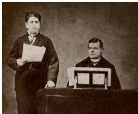
Alessandro Moreschi, l'angelo di Roma. El último castrato

Aguiló, viola da gamba y Sara Erro, clave), el miércoles 29.