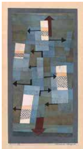
Equilibrio inestable, 1922

diferentes maneras. Por ejemplo, utiliza la flecha como símbolo del movimiento que tiene una dirección clara o expresa la dinámica mediante motivos giratorios.