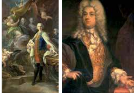
Farinelli y Senesino

ría a ser compositor. Para comprender la naturaleza excepcional de Farinelli vale la pena reproducir, de entre los numerosos testimonios que elogian sus dotes, el del historiador y músico Padre Giovanni Battista Martini, recogido por su primer biógrafo, Giovenale Sacchi ( Vita del Cavaliere Don Carlo Broschi , Venecia, 1784): “Dotado por la naturaleza de una voz agradable, dulce, fuerte, penetrante y amplia desde lo más grave has-