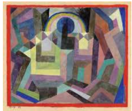
Con el arco iris, 1917

Paul Klee logra un manejo seguro del color relativamente tarde. Durante largo tiempo se dedicó de forma intensiva a la pintura sobre el dorso de cristales y a las acuarelas en negro. En numerosas acuarelas de la época de la Bauhaus encontramos gradaciones tonales con pares de colores complementarios. El estudio del orden de los colores también se detecta en los cuadros de cuadrados.