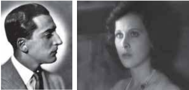
Gustav Machaty y la actriz Hedy Lamarr en un fotograma de Éxtasis

cuando el cine sonoro sonaba en Hollywood y en el centro de Europa lo que se empezaba a oír era ruido de botas y un presagio de mundo enmudecido. Éxtasis es, hoy, un recipiente único que contiene dos universos contradictorios, el de un cine mudo ya difunto y el de una de esas estrellas que lució ahí por primera vez y para siempre, Hedy Lamarr. Aunque el sello de ese pasaporte a la eternidad (de ella y de la película) lo estampa una escena nunca antes vista en una pantalla de cine comercial: la jovencísima actriz protagonista (todavía no era Hedy Lamarr, sino Hedwig Eva Maria Kiesler) corría completamente desnuda por el campo. Una escena larga, llena de una perfecta naturalidad y que prelude lo que es la esencia de