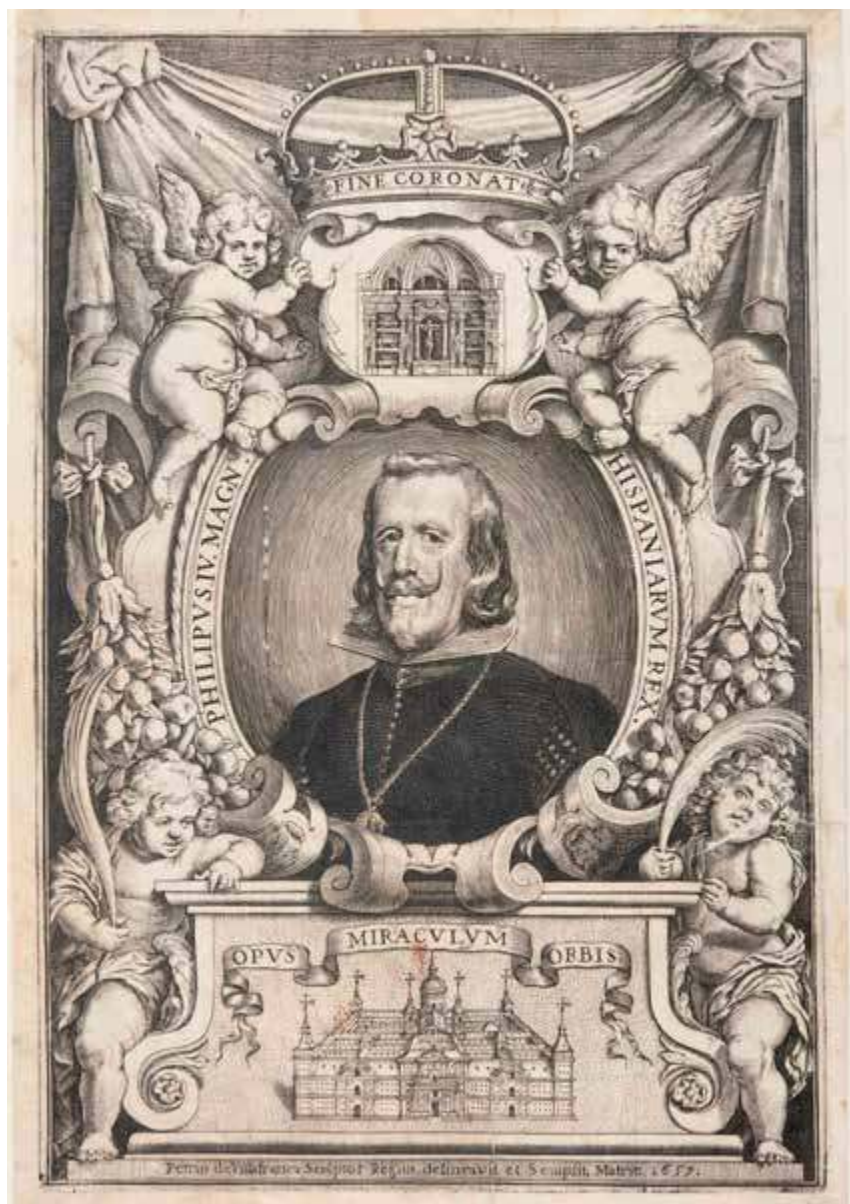
Retrato de Felipe IV, 1657, dibujado y grabado por Pedro de Villafrañca. Grabado calcográfico, aguafuerte y buril, 263 x 177 mm. Anteportada de la obra de Francisco de los Santos, Descripcion breve del Monasterio de S. Lorenzo el Real del Escorial... , Madrid, Imprenta Real, 1657. Biblioteca Nacional de España. ER/4723.