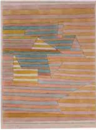
Oasis Ksr., 1929