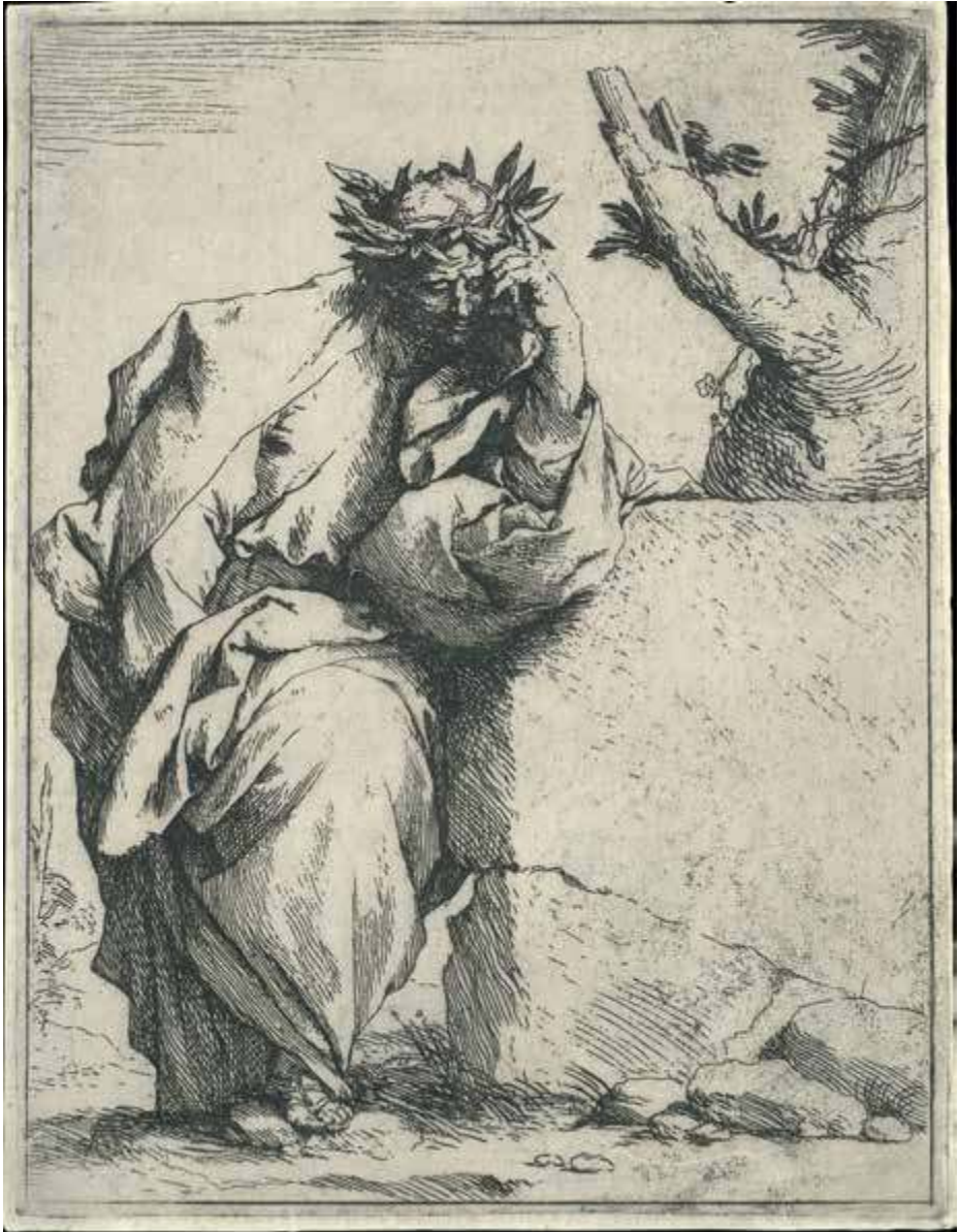
El poeta , c. 1620-1621. Inventado y grabado por Jusepe de Ribera Grabado calcográfico, aguafuerte. 162 x 125 mm.

Harris Brisbane Dick Fund, 1930 (30.54.69)