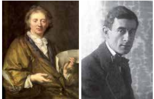
François Couperin y Maurice Ravel

Tras el resquebrajamiento de la tonalidad, sostén armónico durante más de tres siglos, y la progresiva disolución de las formas musicales convencionales, acentuada durante el final del Romanticismo, el compositor se enfrentaba a la imperiosa necesidad de encontrar un nuevo lenguaje musical. A esta misión se dedicaron con vehemencia las vanguardias históricas, que en su empeño por buscar nuevas estéticas acabaron legitimando la noción