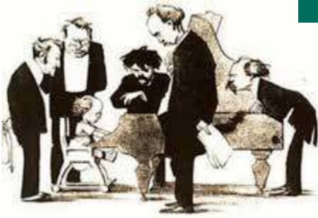
Caricatura del compositor E. W. Korngold al piano como niño prodigio, observado por Siegfried Wagner, Max Reger, Artur Nikisch, Richard Strauss y Eugen d'Albert (de izquierda a derecha)

to de inicio de la canción romántica de concierto como género musical autóctono. Gretchen am Spinnrade : quizá el texto más difundido, más representativo y más hondamente inscrito en el imaginario de la cultura germánica.