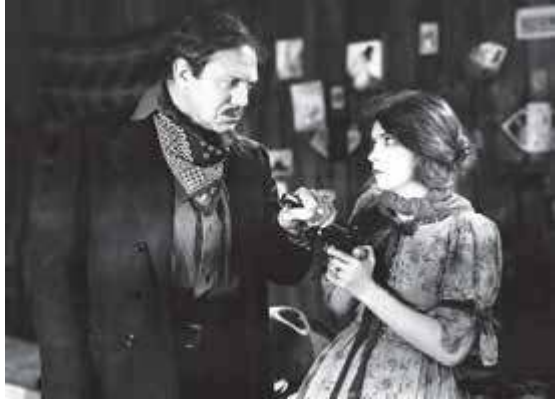
Dos fotogramas de El viento y Victor Sjöström

presentó a la actriz Lillian Gish en lucha contra el viento huracanado en las planicies de Texas, convirtiendo con ello de modo muy poético a la naturaleza en un agente dramático de la acción, según la tradición del cine nórdico.”