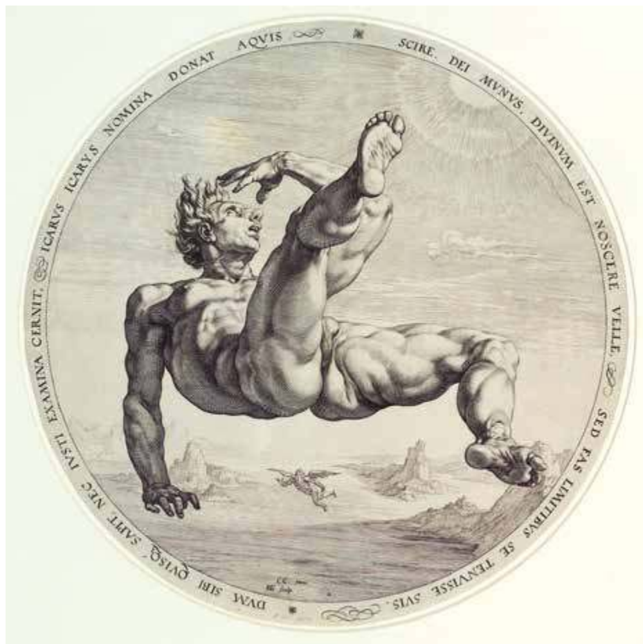
Ícaro , 1588. Grabado por Hendrick Goltzius, por invención de Cornelis Cornelisz van Haarlem Grabado calcográfico, buril. Diámetro: 335 mm. Print Collection, The Miriam and Ira D. Wallach Division of Art, Prints and Photographs. New York Public Library, Nueva York