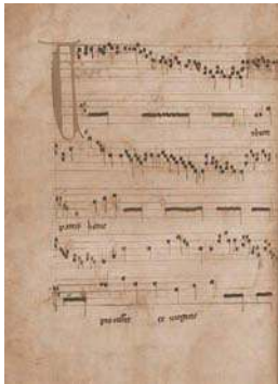
Códice de las Huelgas: Organum Verbum Patris hodie , f. 26v

La celebración de la Navidad y de la Semana Santa –conmemoración del principio y el fin de la vida de Jesús encarnados en las fiestas del Nacimiento y la Resurrección– conforman los dos momentos más importantes del calendario litúrgico cristiano. Y consecuentemente estaban acompañados de un sofisticado despliegue ceremonial en el que el canto constituyó uno de sus principales ingredientes desde los mismos inicios. En un sentido amplio, el tiempo de Navidad se extiende desde la Natividad de Jesús, fijado el 25 de diciembre, hasta la Epifanía, el 6 de enero, en recuerdo de la aparición de los Tres Reyes venidos de Oriente según narran los relatos bíblicos. Entre ambas festividades se situaba la fiesta de la Circuncisión el 1 de enero, en la octava de la Natividad. Estos tres acontecimientos, algunos bien instaurados an-