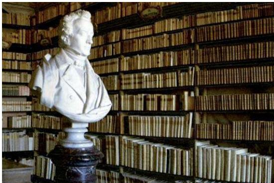
Biblioteca Leopardi en Recanati (Italia) y poema manuscrito del autor