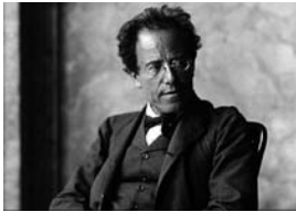
Gustav Mahler, Antonia Mercé, "La Argentina", Liszt y Thalberg. Abajo, Marie Curie y Voltaire