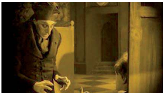
Fotograma de la película Nosferatu

y de la película en cuestión escribe Román Gubern en su Historia del Cine : “Murnau demostró desde muy joven su inquietud cultural y estudió filosofía (Berlín), historia del arte, literatura (Heidelberg) y música. Fue actor con Max Reinhardt (la deuda del cine alemán hacia Reinhardt es enorme) y durante la guerra combatió como oficial de infantería y luego como piloto, siendo derribado en ocho ocasiones. La revelación de su potencia expresiva tuvo lugar en 1922 con Nosferatu, el vampiro . Enfrentándose a la tendencia expresionista de rodar todas las escenas en estudio y en decorados plásticamente dislocados, Murnau recurrió principalmente a escenarios cuidadosamente elegidos. Con calles de Wismar, Rostock y Lübeck compuso una única ciudad y rodó sus paisajes parte en Silesia y parte en Eslovaquia. Con esta innovadora introducción de elementos reales en una historia fantástica, consiguió Murnau potenciar su estremeceadora veracidad. Realismo y fantasía forman un todo coherente en esta historia romántica que debe menos a la vampirología que a cierta temática muy arraigada en toda la obra de Murnau, como la obsesión por la idea de la Muerte, el tema de la felicidad de una pareja perturbada por la presencia del Mal (Nosferatu) y el papel expiatorio de la mujer, que con su voluntad de abnegada entrega derrota al vampiro. A quebrar los cánones teatralizantes