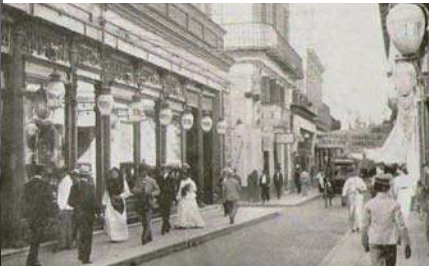
Alejo Carpentier (página anterior). De izquierda a derecha, Manuel de Falla, Joaquín Turina y una foto antigua de La Habana.