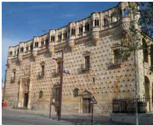
Palacio de los Duques del Infantado, Guadalajara

te referida a la batalla de Pavía (24 febrero 1525) en la que fue apresado Francisco I de Francia y llevado prisionero a Madrid. Las canciones alusivas a la insólita captura del rey francés no debieron faltar y Flecha lo demuestra incorporando, entre otras, una que califica a Francisco I nada menos que de cobarde.