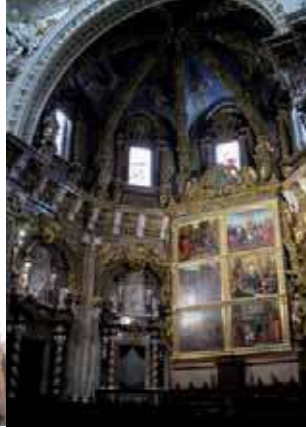
Fachada gótica y retablo del altar mayor de la catedral de Valencia

género que le proporcionaría si no fortuna sí al menos fama.