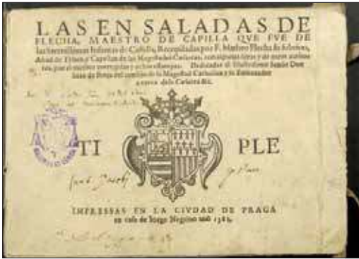
Cubierta del cuaderno del Tiple del impresor de Las ensaladas

miento español era un tipo de piecillas breves en lengua vernácula, vinculadas primero a los servicios de la Nochebuena y luego a los de otras festividades sacras. Nos referimos al villancico, un género nacido hacia el último tercio del siglo XV cuya compleja historia se prolonga hasta el día de hoy.