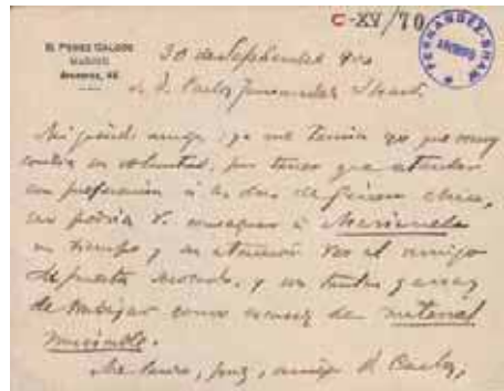
Carta de Benito Pérez Galdós (30/09/1900) sobre la obra Marianela

Carlos Fernández Shaw fue autor, entre otras