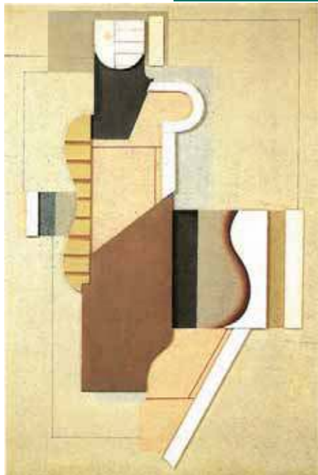
Cuadro muro negro-rosa, 1923