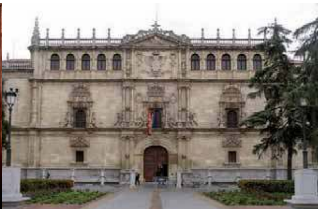
Fachada del Colegio Mayor de San Ildefonso de la Universidad de Alcalá de Henares, fundada por Cisneros

Prefigura el intervencionismo del Estado moderno en cuestiones económicas. Para él, el Estado debe velar por el bien común y situarse por encima de las facciones y de los partidos. Con la creación de una milicia permanente procura formar una tropa que esté siempre a las órdenes del monarca. La nobleza terrateniente se opuso al proyecto. La España con la que soñaba Cisneros habría sido muy distinta de la que configuró el emperador Carlos V. Desgraciadamente para España, la hora de Cisneros llegó tarde. Él fracasó en su empeño de reformar la administración y la forma del gobierno. Sus intentos, de signo mercantilista, por desarrollar la industria nacional, limitando las exportaciones, no podían ser del agrado de un soberano que reinaba a la vez sobre Flandes y Castilla: los flamencos necesitaban de la lana castellana, base de su prosperidad; a los aristócratas castellanos, dueños de rebaños y pastos, y a los mercaderes de Burgos les interesaba la exportación de aquella lana. Los comuneros de 1520 recogieron algunas de las ideas directrices de Cisneros; ellos también chocaron con el poderío de la nobleza.