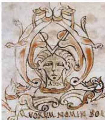
El rey Edgar en el centro, en un manuscrito del siglo XI (British Library, Londres) Inicial ornada con mención a Abbo. Manuscrito de la Abadía de Saint-Benoît-sur-Loire, Biblioteca Municipal de Orléans

ción de la perspectiva en la pintura. Se convertiría, en definitiva, en una de las mayores innovaciones que ha presenciado la historia de la música occidental. Los tres conciertos de este ciclo proponen un recorrido abreviado por este periodo de la historia de la música, tan crucial en sus consecuencias seculares como desconocido para el público actual.