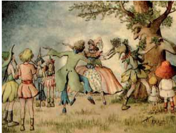
Portada de la partitura Álbum de Colien (1995). Ilustración de Richard Klimsch

El programa de este “Aula de (Re)estrenos” ofrece una amplia representación de la creación española más reciente para el piano inspirada en el mundo infantil. Podrán escucharse obras de hasta quince compositores, en su gran mayoría compuestas entre 2003 y 2009. La excepción son dos notables antecedentes: los Preludios de Mirambel de García Abril, dados a conocer en 1984, y el Álbum de Colien (del que se escuchará una selección), conformado por obras breves de hasta 38 compositores estrenado, precisamente por Ananda Sukarlan, en 1995.