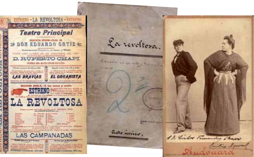
De izquierda a derecha, programa, manuscrito original y personajes de La Revoltosa

sica de Manuel de Falla. Mantuvo una intensa actividad política y social como diputado por Cádiz y como periodista en los principales diarios de la época. Prueba de ello es su archivo epistolar, compuesto por más de cuatro mil cartas, de enorme riqueza. Su análisis resulta clave para el estudio de su época y de las relaciones con y entre intelectuales. En él destaca la correspondencia con músicos tales como los citados Manuel de Falla (74 cartas), Ruperto Chapí (44 cartas), Tomás Bretón (30 cartas), Amadeo Vives (32 cartas), Conrado del Campo (9 cartas) o Enrique Granados.