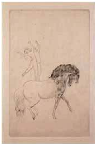
Los dos saltimbanquis y En el circo, 1905

Situado en el centro del museo, el Gabinete de obra gráfica del Museu Fundación Juan March acoge y exhibe, de forma rotatoria, los fondos de obra gráfica de Pablo Picasso, pertenecientes a la colección en depósito del Museu. En esta ocasión, desde el 16 de mayo hasta el 12 de noviembre, el Gabinete presentará algunos de los primeros grabados de Picasso, cuyo tema principal es el circo.