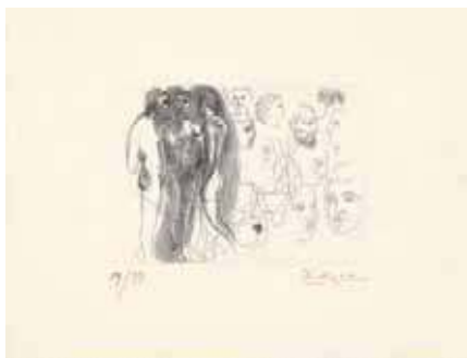
Tres desnudos de pie con esbozos de cabezas, 1927-31

En la misma línea de ofrecer en verano en su sede exposiciones de pequeño formato, como la dedicada el pasado año a tres acuarelas y doce aguafuertes de Giorgio Morandi, la Fundación Juan March exhibe, del 1 de junio al 23 de julio, la muestra Pablo Picasso y “La obra maestra desconocida” de Honoré de Balzac , integrada por los trece aguafuertes originales realizados por Picasso en 1931 a propósito del texto homónimo de Balzac.