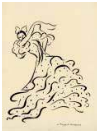
La Argentina, Danza del fuego. Dibujo, 1935, de L. Pageot-Rousseaux

La colección, reunida por la misma artista, su hermano y su sobrina, está compuesta por seis álbumes con recortes de críticas y entrevistas aparecidas en la prensa nacional y extranjera en vida de la bailarina; tres álbumes con noticias de prensa desde su fallecimiento hasta 1988, un álbum con diversa documenta-