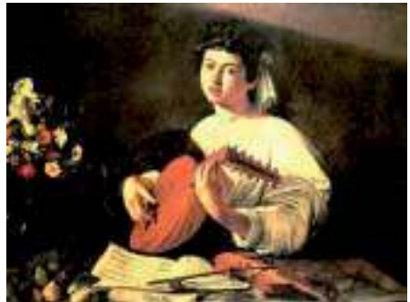
El tañedor de laúd, por Caravaggio