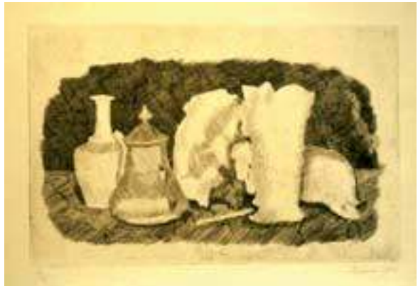
Naturaleza muerta, 1930

En 1913, tras superar con ciertas dificultades el examen de aptitud para la enseñan-