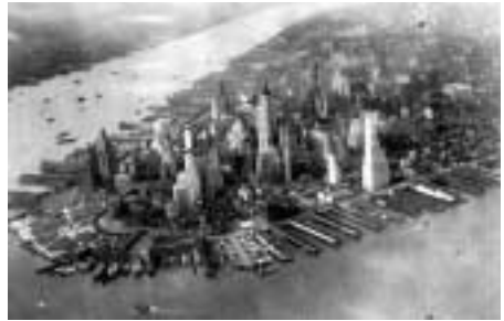
Vista aérea de Manhattan, Nueva York, en 1942

Este concierto muestra también otra faceta que el jazz ayudó a poner de manifiesto