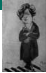
Caricaturas de Franz Liszt y Ferruccio Busoni

nitivamente, adquirió un nuevo estatus compositivo.