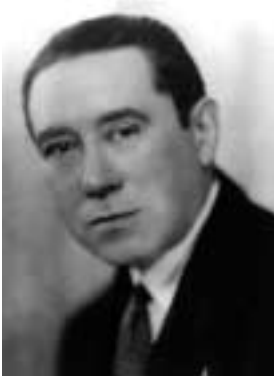
Joaquín Turina en 1929

vados de César Franck), Turina recordó siempre la regla fundamental que el maestro le había enseñado –que «se escribe más música con la goma que con el lápiz»– e hizo suyas aquellas cualidades que más admiraba en la obra de d'Indy: «forma, tonalidad, plan, distinción, potencia».