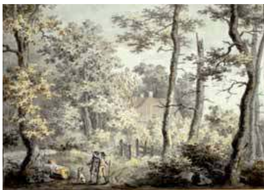
Casa de campo en el Laubwald, 1797 (Galerie Häns, Hamburgo)

Con una exposición de obra sobre papel de Caspar David Friedrich (1774-1840) el próximo 16 de octubre abrirá la Fundación Juan March su temporada artística. Más de 60 obras del artista alemán en diversas técnicas podrán contemplarse en Madrid en las nuevas salas de exposiciones de la Fundación.