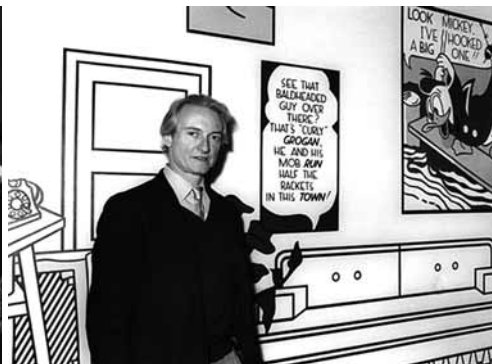
Juan Benet (izquierda) en un ciclo sobre «Novela española contemporánea» (1975), y Roy Lichtenstein ante una obra de su exposición en la Fundación, en 1983

que se encuentra en la página web. Presentadas las exposiciones por especialistas españoles y extranjeros, en varias ocasiones, en todos estos años, han sido los propios artistas –Robert Motherwell, Rauschenberg, Lichtenstein, David Hockney o el galerista neoyorkino de muchos de ellos, Leo Castelli– los que intervinieron en el acto, enriqueciendo aún más con sus palabras el audio recogido.