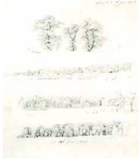
Estudios de árboles, 1809 (Kunsthalle Bremen)

También se ofrecía una acuarela del artista alemán – Paisaje en los montes de Silesia , s.f.–, en la exposición De Caspar David Friedrich a Picasso. Obras maestras sobre papel del Museo Von der Heydt de Wuppertal (2001). «Al igual que muchos paisajistas de su época –escribía Antje BIRTHÄLMER en el catálogo de esta muestra– Caspar David Friedrich gustaba de emprender largos viajes a pie para estudiar la naturaleza y recoger impresiones