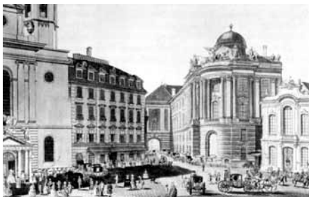
El Burgtheater (derecha) en la Michaelerplatz de Viena. Grabado de Carl Schütz (1783)

Un recorrido cronológico que recree el «paisaje sonoro» de algunas ciudades que en un momento concreto de la historia desempeñaron un papel trascendental para la evolución de la música es la propuesta de este nuevo ciclo de Lunes temáticos , titulado El sonido de las ciudades . Serán ocho conciertos, de octubre a mayo, el primer lunes de cada mes a las 19,00 horas.