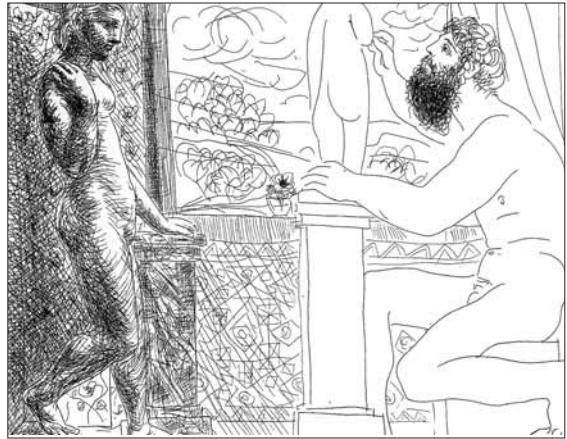
Escultor y modelo ante una ventana, 1933 ( Suite Vollard )

En el conjunto de la Suite Vollard se pueden apreciar claramente cuatro temas: El taller del escultor , El minotauro , Rembrandt y La batalla del amor , más tres retratos de Ambroise Vollard realizados en 1937. Algunos de los temas tienen su origen remoto en un relato breve de Honoré de Balzac, titulado Le Chef-d'œuvre inconnu (La obra maestra desconocida, 1831), cuya lectura impresionó profunda-