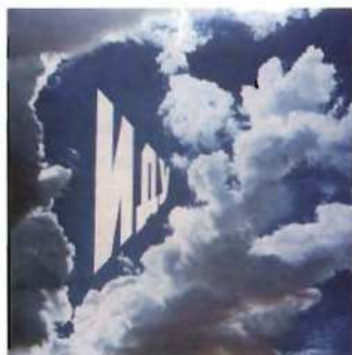
¡Voy!, 1975, de Érik Bulátov