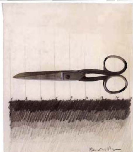
Sin título, 1971, de Joan Hernández Pijuan

El martes 11 de noviembre, Susana Solano (una de las escultoras con mayor proyección internacional, una artista multidisciplinar que trabaja y se mueve de forma indiferente por la escultura, con hierro, malla metálica, plomo..., el dibujo, la fotografía, la vídeo creación y la instalación), bajo el título El dibujo sin exceso , planteó un concepto de dibujo que se aleja totalmente del convencional, describiendo cómo en lo cotidiano está presente una red invisible de dibujos, y lo definió como un secuestro, algo que funciona de forma contenida, que no tiene ni principio ni fin, como quietud e inmovilidad, como la nostalgia de un gesto irrepetible. Planteó una serie de condiciones previas que deben darse en el dibujo, siempre desde una perspectiva totalmente subjetiva, hablando de la necesidad de tener un pretexto, una motivación y de tener obsesivamente clara la distancia; para ella, eso significa que únicamente cuando una idea está mentalmente muy clara y pide manifestarse, finalmente elige los medios que utilizará.