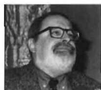
Fernando Savater LA ÚNICA SUMISIÓN

❖ Salón de actos, 19,30 h. Entrada libre