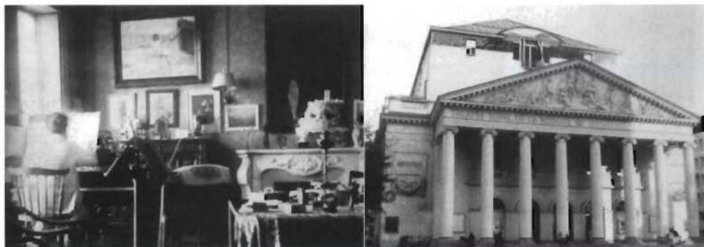
Albéniz componiendo al piano en su apartamento de París (izquierda). El Théâtre Royal de la Monnaie de Bruselas, donde se representaron con éxito en 1905 la ópera Pepita Jiménez y la zarzuela San Antonio de la Florida de Albéniz

dett Money-Coutts (1854-1923), un acaudalado abogado y poeta inglés. Albéniz lo conoció en Londres a comienzos de la década de 1890 y se hicieron grandes amigos. Money-Coutts le proporcionó a Albéniz unos generosos ingresos anuales a cambio de poner música a sus propios poemas y libretos de ópera. Aunque algunos se han referido a esto como un «pacto fáustico», lo cierto es que el acuerdo le permitió a Albéniz centrarse en la composición después de renunciar a seguir tocando y al tiempo que su salud se deterioraba. Sin esta ayuda, Albéniz no podría haber compuesto probablemente su obra maestra por antonomasia, Iberia (1905-1908). De hecho, Money-Coutts siguió ayudando a la familia del compositor durante muchos años después de la muerte de Albéniz.