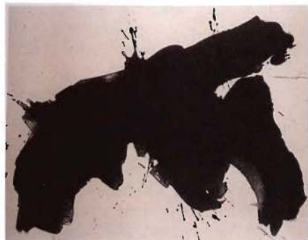
Ilustración de R. Motherwell para el poema «Piel/Sonido del mundo», de Octavio Paz