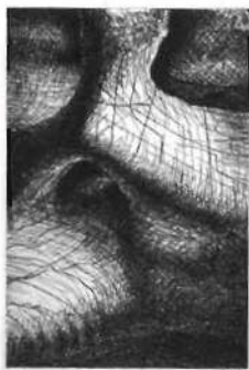
Lámina X de la carpeta «Elephant Skull», 1970, de Henry Moore