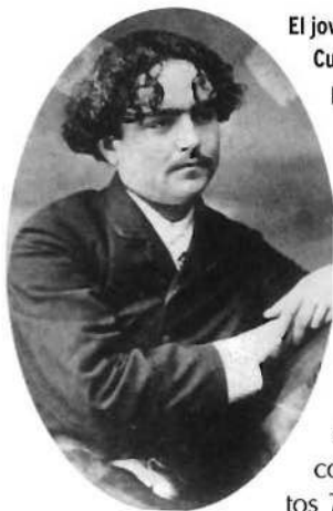
El joven Albéniz era ya famoso en España y en Cuba como un extraordinario virtuoso del piano

habría de convertirse en la figura más destacada en el desarrollo del nacionalismo musical español, se sentía distanciado de su país natal y pasó la mayor parte de su vida adulta lejos de él.