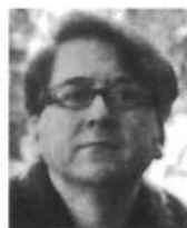
Luis Antonio de Villena UN RICO ENTRAMADO

Los libros recientes son Ovejas negras , La pasión domesticada y Abierto a todas horas . Escritor experto en todos los géneros, su obra se caracteriza por un notable sentido del humor y una profunda capacidad de análisis.