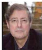
Félix de Azúa HÉROES TRIVIALES

Magnífico invento del romanticismo tardío, el dandy es otra de las múltiples figuras cons-truidas por la burguesía para sustituir los valores de una aristocracia decapitada. Aquella sociedad que se había quedado sin cabeza avanzaba a tientas por la revolución industrial, cuando la democracia y su correspondiente control técnico aún estaban en ciernes y carecían de apoyatura mediática, es decir, de los ojos y la boca de la sociedad dineraria.