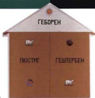
Nacido. Alegre. Muerto, 1989, de Iuri Léiderman