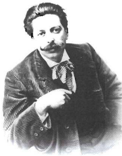
Retrato de Granados en 1900

Si bien como compositor sintió predilección por el piano, trabajó otros géneros. Coincidiendo con sus primeros años de matrimonio, se esforzó en dar a conocer su música escénica, primero en Madrid, donde en 1898 se estrenó María del Carmen y después en Barcelona, donde compuso para el teatro de sus amigos modernistas, Apelles Mestres y Adrià Gual. Aunque la vida musical mostraba una clara primacía de la ópera, el intento de reconstrucción de una ópera nacional –tal y como la venía predicando Pedrell– tuvo resultados menos exitosos de los que cabía esperar. No obstante, este esfuerzo indujo al despertar de una conciencia musical nacionalista que imprimiría la vitalidad necesaria que algunos críticos avinieron en llamar Renaissance musicale espagnole , en referencia a una supuesta –y discutible–