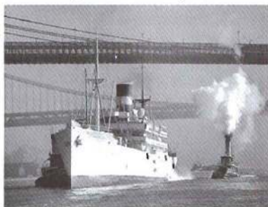
Barcos en el East River, Nueva York, 1940, de A. Feininger

nos ofrecen como una aproximación a su pensamiento. Además del catálogo, se ha editado un libro que recoge una selección de los Iris de Pascua , dibujos que el artista catalán pintaba cada año, desde 1988, en la época de Pascua. ♦