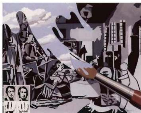
El pincel mágico, 1970

Formado a finales de 1964 por Manolo Valdés, Rafael Solbes y J. A. Toledo —este último abandonó el grupo en 1965—, el Equipo Crónica produjo su obra en series: una veintena a lo largo de su