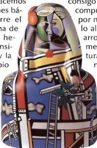
Menina V, 1982

tas iconográficas de la obra de Picasso. Sobre esta circunstancia, nada casual por supuesto, discurren las coordenadas argumentales citadas arriba. En primer lugar queremos advertir que su intención no es, al menos en primera instancia, la de constituir un nuevo homenaje hacia la figura o la obra de Picasso. En todo caso eso ya lo hemos hecho, implícita y explícitamente, en otras ocasiones, a nuestro entender menos vidriosas y ecuménicas que la presente «grande rentrée» española. No obstante, sería erróneo considerar que no existe relación entre este singular centenario pseudo oficial y nuestra serie. El entusiástico, propagado y bastante utilizado reconocimiento oficial del pintor malagueño, sin duda merecido, aunque tardío, arrastra consigo tal cantidad de entresijos y compromisos que resulta difícil, por no decir imposible, valorarlo al margen del irregular desarrollo del conjunto de fenómenos políticos, sociales, culturales, etc..., de la vida nacional. Los más diversos estamentos, institucionales y privados, se agitan en torno al centenario y a la inmanente llegada del Guernica y, desde luego, no siempre por inquietudes propiamente culturales. ♦