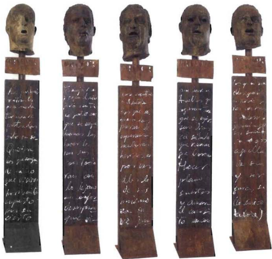
Oradores, 1987-89 178 cm. altura