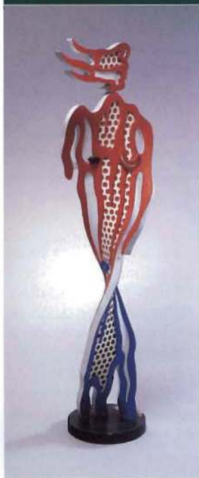
Desnudo pincelada (Aluminio fundido pintado), 1993

El arte pop , que eleva los productos de consumo a objetos de arte «culto», no es improvisado ni carece de método. Ésta es la propuesta de la exposición Roy Lichtenstein: de principio a fin , que trata de explorar y recrear el complejo proceso artístico del pop de la mano de uno de sus más reconocidos maestros.