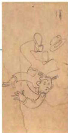
Cuaderno «Vernon Royal Compositions», página 34. Dibujo para Dos cuadros: Dagwood (1983). Grafito sobre cartón amarillento. Dibujo para dos cuadros: Dagwood. Grafito y lápices de colores sobre papel (1983).