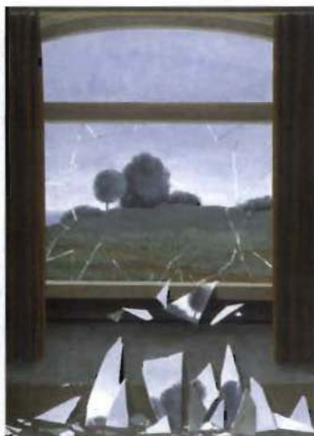
El visitante, 1953, de Richard Lindner (izquierda), y La llave de los campos, 1936, de René Magritte

presentados en esta exposición de exposiciones es espectacular. Se corría el riesgo de que, a pesar de tal acumulación de estrellas por metro cuadrado, la muestra no tuviera cohesión y quedara un tanto descabada, pero el resultado es francamente interesante.»