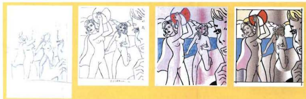
Dibujos y collage para Desnudos con pelota de playa, 1994.