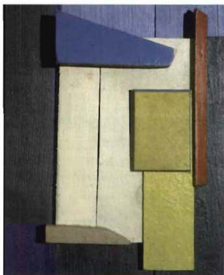
Azul, 1923-26, de Kurt Schwitters

«En mi opinión, la andadura de la Fundación Juan March siempre ha sido autónoma respecto a nuestra historia contemporánea. Sólo le ha interesado el Arte –así, con mayúsculas– y su destino en el público, estuviera éste informado o quisiera estarlo.