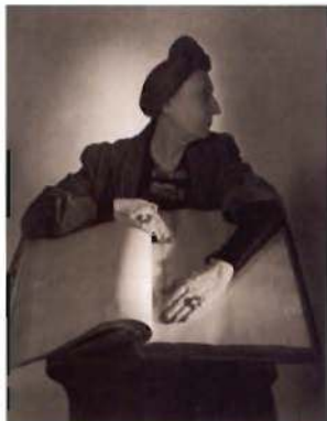
De izquierda a derecha, Edith Sitwell, de Horst P. Horst, 1948; Vera, de Raoul Hausman, 1931; y Georges Sand, de Nadar, 1877