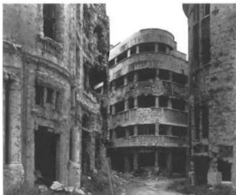
Rue Allembey/Rue Fakhry Bey, 1991-95, de Gabriele Basilico

Francisco Caja hizo un repaso a la modernidad, desde finales de los años cincuenta, centrándose en las propuestas contradictorias de Robert