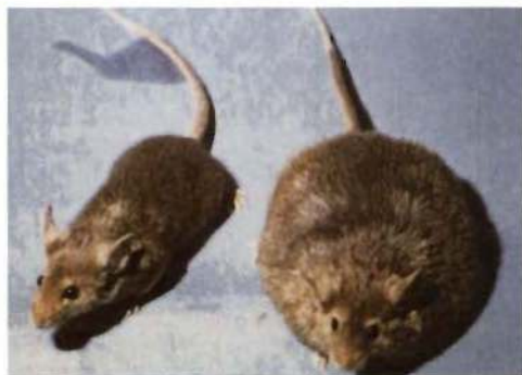
Las proteínas desacoplantes están implicadas en el control del peso corporal

ción de componentes celulares, transporte, transmisión de señales, etc. El ATP se sintetiza utilizando la energía que queda disponible de la oxidación (quema) de grasas y azúcares en la célula. La síntesis tiene lugar en un compartimento de la célula llamado mitocondria, que viene a ser, por tanto, como una central de energía. La energía liberada durante la oxidación de los sustratos es utilizada para bombear protones desde dentro hacia fuera de la mitocondria generando un gradiente de protones que, de modo análogo al existente entre los bornes de una batería, se puede utilizar para realizar trabajo.