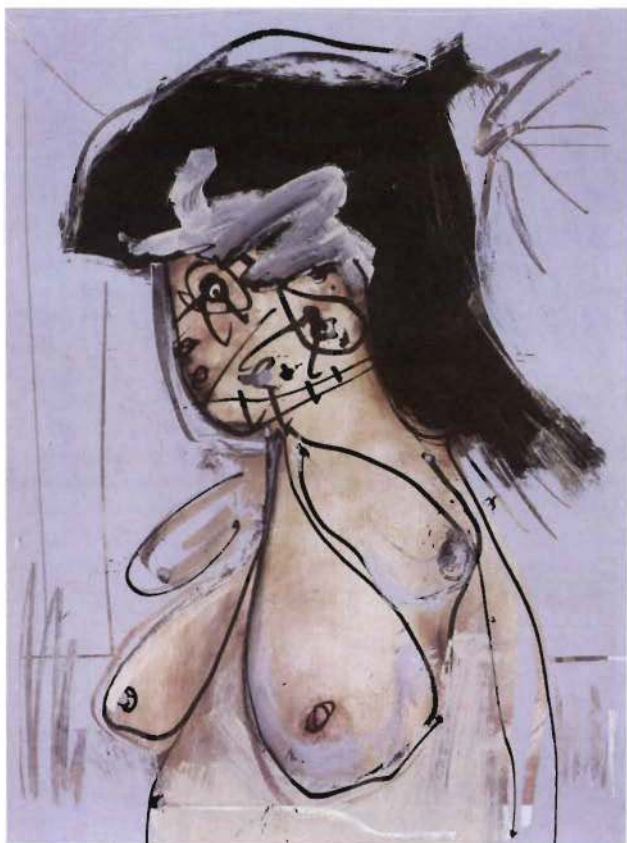
La quinta del sordo 2, 1980

En el verano de 1953, Antonio Saura participó en el Curso Internacional de Arte Abstracto de Santander, donde se reunieron los grupos de artistas y críticos de Madrid y Barcelona que en aquel momento se preocupaban por renovar el lenguaje plástico español y apostaban por la abstracción. De esa reunión saldrían los miembros del grupo El Paso, que Saura funda en 1957 y dirigirá hasta su disolución, tres años más tarde. En ese mismo año de 1953, Antonio Saura marcha a París, donde permanece hasta