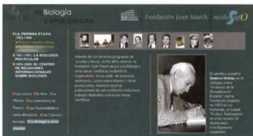
Severo Ochoa en 1975, en el coloquio-homenaje de su 70º aniversario