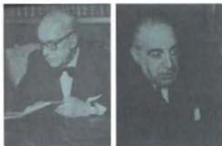
Carlos Jiménez Díaz y Gregorio Marañón obtuvieron el Premio March de Ciencias Médicas, en 1957 y 1960, respectivamente

En las Conferencias Juan March sobre Biología , abiertas al público, celebradas cada año desde 1982 hasta 1999, se dio cita la plana mayor de la biología internacional y española: 77 conferenciantes expusieron los resultados de sus investigaciones.