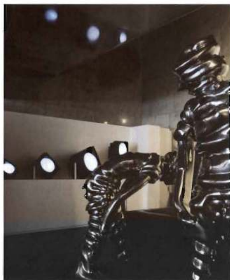
Grandes espíritus, de Thomas Schütte

S in proyecto ni programa, dejados como quien dice a solas con la Historia, ha cambiado radicalmente nuestra forma de habitar y mirar el mundo. El proyecto moderno no vivía en lo próximo sino, digamos, en el anhelo del confín. Así, en la abstracción formalista, tal como por ejemplo la ha revisado Jan Dibbets, es evidente cómo la mirada se despega de lo cercano inmediato para circular por un puro esplendor geométrico, ya sin fisonomía singular. (...) Nunca ha sido más cierto que ahora aquello que afirmara Rimbaud: es falso decir yo pienso , habría que decir se me piensa o me piensan . Es bajo este espíritu de cruel ficcionalización y extimidad (esto es: una