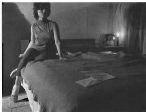
Sin título (Film Still nº 33), 1979, de Cindy Sherman

El arte contemporáneo demasiado a menudo se ha visto abocado a una poética del literalismo que no ha hecho más que profundizar esta nostalgia de la presencia, la propia insignificancia de sus acontecimientos ridículos o precarios, allí donde el sentido se desploma en la estupidez, la sobredosis del terror o la síncope traumática del miedo. Necesitamos, más bien, convertir este desierto en la alegría del suceder, restaurar al tiempo el fulgor del vértigo y de lo inaudito. Reinventar lo real como quien levanta una ficción fundamental, una ficción suprema, una nueva cartografía por donde circule un imaginario suficientemente poderoso. Esto es: hacer de un acontecimiento, por pequeño que sea, la cosa más delicada del mundo. Sin embargo, y asimismo demasiado a menudo, el artista actual no parece tender hacia otra cosa que reducir esta potencia a una triste historia personal, construyendo el relato enfático de un pequeño drama. Tiempo de tristezas y de histeria. (...) En nuestra contemporaneidad sólo interesa una de estas capacidades: la de convertir todo interior en exterioridad pura. La de hacer pública toda interioridad.(...) ♦