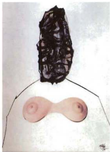
Dama, 1965 y Dama, 1960-68