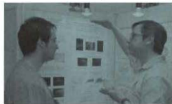
Paneles de trabajo en un workshop

En 1991 se creó el Centro de Reuniones Internacionales sobre Biología, dentro del Instituto Juan March de Estudios e Investigaciones, para promover la cooperación y el intercambio de conocimientos entre los científicos españoles y extranjeros. Cerca de 5.000 científicos extranjeros han participado en sus actividades, entre ellos 53 Premios Nobel.