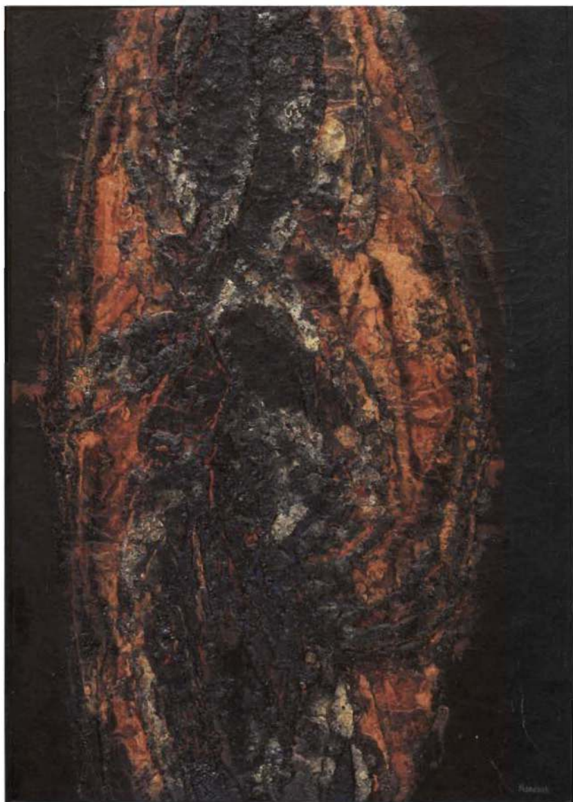
Pintura nº 100, 1962