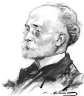
Felipe Pedrell, por Ramón Casas

Ni el autor ni la editorial eran nuevos en lo que