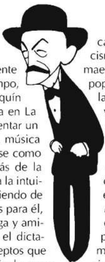
Falla, por Bagaría

«E n Falla hay una doble personalidad de lo más antagónica que puede darse: siente como los gitanos y, al mismo tiempo, es un místico». Así se expresó Joaquín Turina en una conferencia dictada en La Habana en 1929 dedicada a presentar un panorama, entonces actual, de la música española. La cita podría entenderse como una ocurrencia, una agudeza más de la gracia turiniana. Realmente, refleja la intuición de un gran compositor definiendo de forma breve pero precisa lo que es para él, esencialmente, la obra de su colega y amigo Manuel de Falla. Nótese que el dictamen de Turina encierra dos conceptos que han sido ampliamente aplicados, incluso nos atreveríamos a decir que hasta convertirse en tópicos, por la críti-