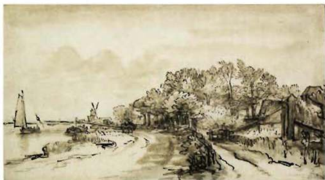
Vista a orillas del Amstel, hacia 1649-1650, de Rembrandt

«Representada aquí por una selección de 84 obras maes-