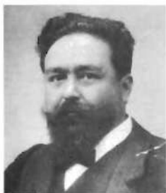
Isaac Albéniz, en 1888

Isaac Albéniz (1860-1909) es el músico español más relevante de todo el siglo XIX y la influencia de su obra se proyecta con intensidad durante todo el siglo XX. No obstante, y aunque sus obras para piano le han asegurado un puesto de honor en la historia de la música, pocos son los que conocen su permanente interés por la música escénica,