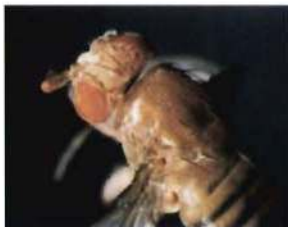
Ojos supernumerarios en la antena y ala de Drosophila

En este curso se reúnen los especialistas del campo de conocimiento molecular del desarrollo de los ojos en organismos que van desde invertebrados hasta el hombre; así como investigadores básicos e investigadores especializados en disfunciones del ojo humano