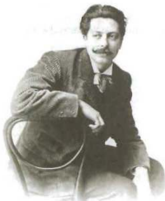
Enrique Granados (Institut del Teatre de Barcelona)

La personalidad musical de Enrique Granados (1867-1916) es suficientemente conocida por el público español de todas las épocas. Sin embargo, el conocimiento que habitualmente se tiene de su aportación a nuestra música suele decantarse más hacia algunos aspectos de su riquísima personalidad en detrimento de otros, quizá no suficientemente conocidos. Granados fue uno de los primeros discípulos de Pedrell, hacia 1884. Es él quien le convence para que salga de España y vaya a París; es también Pedrell el que forja su perso-