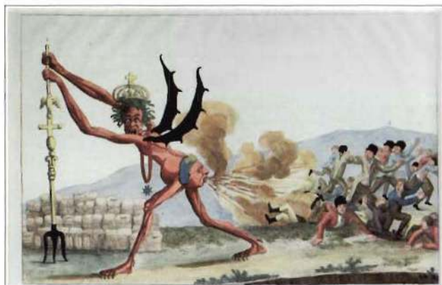
El gobierno inglés - El inglés nacido libre, de J. L. David

gar algo que verdaderamente lo es? ¿Remarcar que su importancia es, en este caso, excepcional?»