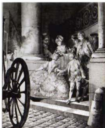
Los pequeños padrinos, de J.-Ch. Baquoy y J.-B. Patas, según Jean-Michel Moreau, el Joven