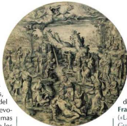
Moisés haciendo brotar el agua de la roca, de Hans Collaert

«Los cambios en la concepción de la naturaleza y del hombre que trae consigo el Renacimiento son perceptibles en los papeles de los italianos Fra Bartolomeo, Roberto o Rafael, cuya hoja de