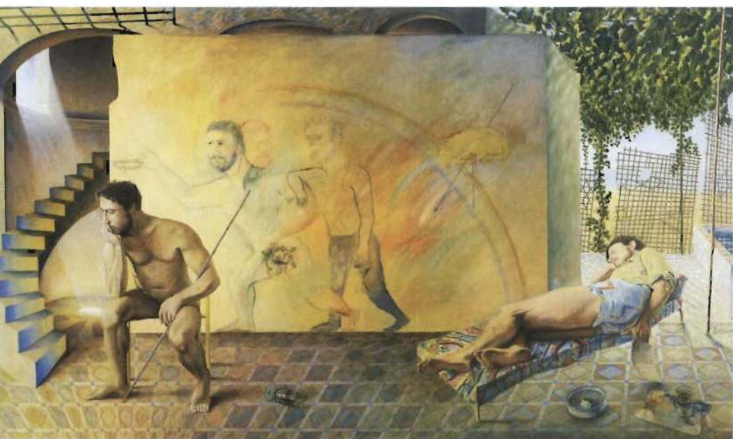
La estancia, 1962-83