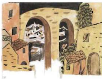
Boceto de un decorado de El sombrero de tres picos , de Picasso

En mayo continúa el doble ciclo de conferencias y conciertos en torno al florecimiento de la música española en la primera mitad del siglo XX en sus figuras más destacadas, desde los «pedrellianos» hasta la Generación del 27.