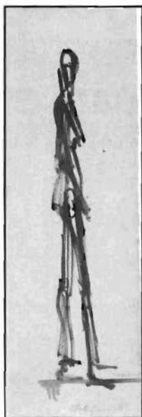
«Figura de pie hacia la derecha», de Alberto Giacometti, 1948