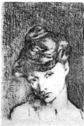
«Cabeza de mujer» (Tête de femme), 1905

Un total de 128 grabados de Picasso inauguran las nuevas salas de exposiciones temporales del Museu d'Art Espanyol Contemporani (Fundación Juan March), de Palma, coincidiendo con la reapertura de éste, tras la ampliación y