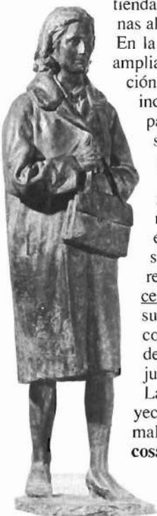
«Úrsula», de Julio López Hernández (1965).