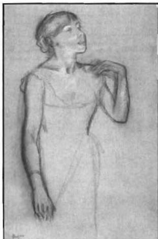
«La cantante del Café-Concert. Teresa», de Edgar Degas, 1883-84

mucho más que nunca de documentos sin solución de continuidad. En este ámbito el papel y la función de la sociedad podían captarse mejor y más objetivamente que en el ámbito de la vanguardia, cuyos puntos de fuga críticos se hallaban casi exclusivamente en el taller, en el manifiesto o en el círculo de unos pocos artesanos y coleccionistas. La cuestión de la continuidad comenzó a cobrar cada vez más importancia frente a la de la superación de la tradición. Hoy día nos parece incomprensible la cesura brusca que defendía la vanguardia para con el denostado siglo XIX. Las láminas de la colección Kornfeld también eluden el concepto simplificador de vanguardia. Todos los trabajos subrayan la importancia de los temas. Muestran personas, paisajes, escenas narrativas, visiones fantásticas o grotescas. La modernidad y la referencia temporal aguda aparecen por doquier como contrapeso de la vanguardia y de su estrechez de perspectivas. El objetivo consiste en hacer reconocibles las irritaciones y rupturas de la época. Se exhibe una sucesión dispar de trabajos que en el momento en que surgieron no