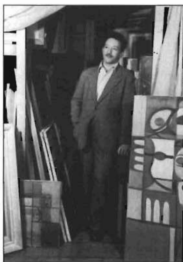
Adolph Gottlieb en Brooklyn, Nueva York, 1942.