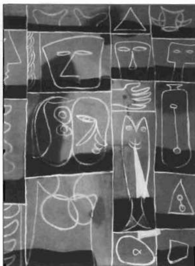
«Mariner's Incantation» (Encantamiento del marinero), 1945.

Al año siguiente comienza sus Pictografías . Éstas incluyen letras, números, formas abstractas y fragmentos de imágenes en una presentación holística. La estructura cuadrículada que escoge Gottlieb venía a ser como una metáfora visual para la modernidad. En las pictografías usaba diferentes combinaciones de pinturas al óleo, gouache, caseína, témpera, lápiz e incisiones para lograr