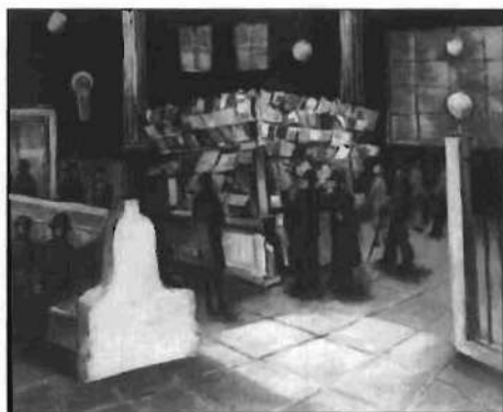
«South Ferry Waiting Room» (Sala de espera del South Ferry), c. 1929.

comienzos de sus respectivas carreras y se constituyeron en los pioneros del grupo de expresionistas abstractos.