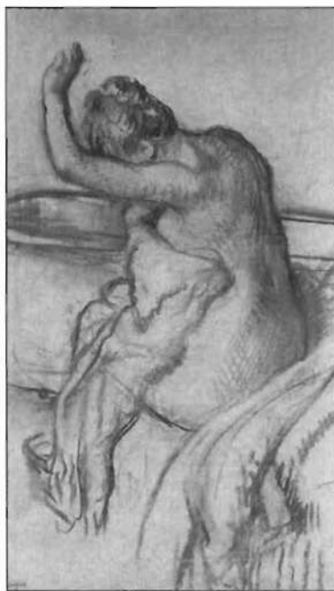
Edgar Degas: «Después del baño», c. 1895