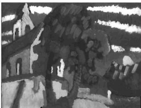
Vassily Kandinsky: «Iglesia de Riegees», c. 1908

tiene ese trazo veloz que expresa una idea y revela un sentimiento, tan cercano a la intimidad del creador. En esta muestra se hallan representadas las diferentes corrientes, desde el romanticismo hasta la abstracción, pasando por el naturalismo, el realismo, el simbolismo, el puntillismo, el impresionismo, el expresionismo o el cubismo...»