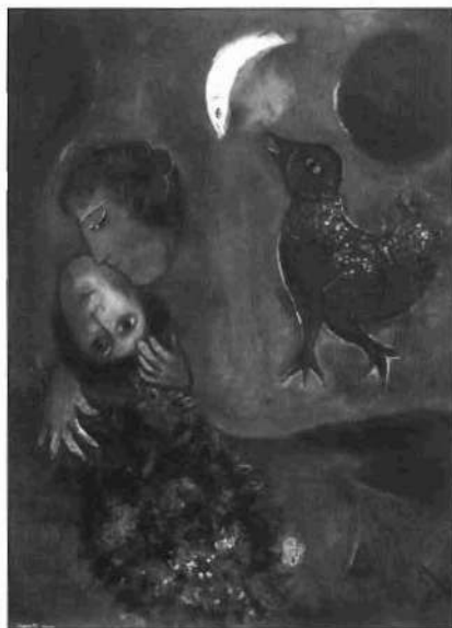
Marc Chagall: «Paisaje azul», 1949

«[Autores como los que recoge la muestra] contribuyeron a que el dibujo se independizara y tuviera una identidad artística propia, similar a la pintura, pero con la frescura que siempre