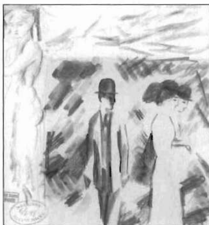
August Macke: «Paseantes; a la izquierda, estudio de desnudo femenino», c. 1913