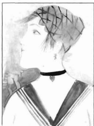
Otto Dix: «Muchacha de una fábrica», 1922