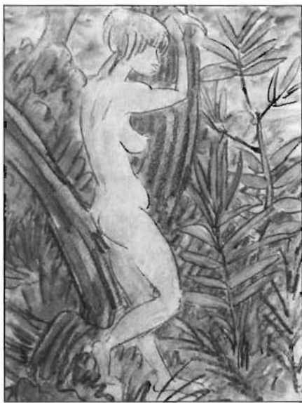
Otto Mueller: «Chica junto a un árbol», c.1924-1925