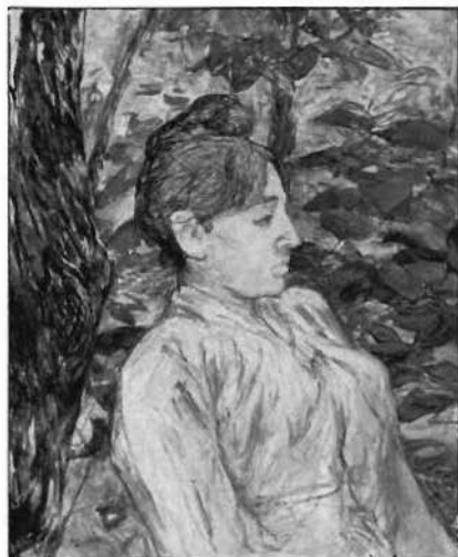
«Bajo el verdor», 1890-91

Lautrec no reduce su dibujo a una pura enunciación visual y cromática. Aunque se inspire en el mundo del music-hall, del teatro o de la prostitución, siempre preserva el contenido humano.