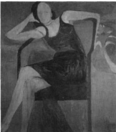
«Mujer sentada», 1967.

Estas pinturas abstractas del período 1948-55 son las primeras obras maduras de Diebenkorn. Son abstractas porque no pueden considerarse paisajes, pero representan cosas e imágenes fácilmente asociables con un paisaje, como glifos orgánicos, bandas horizontales y partes retorcidas. Y su composición, a partir de manchas más o menos grandes, recuerda paisajes. También lo recuerda el modo de pintar: los colores en capas difuminadas sugieren bandas de