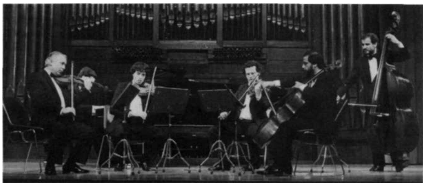
El grupo Incontro Musicale en un momento del concierto.

«En casa de los Turina se guardan autógrafos de gran valor —pequeñas memorias, retratos de personajes de ambiente musical, diarios más o menos resumidos, apuntes autobiográficos y material gráfico—, dignos, todos ellos, de ser llevados a la imprenta. Con ello, tendríamos en España por una vez la posibilidad de un estudio pormenorizado que no es sólo el de un hombre, sino inevitablemente el de la época y las circunstancias en las que vivió.»