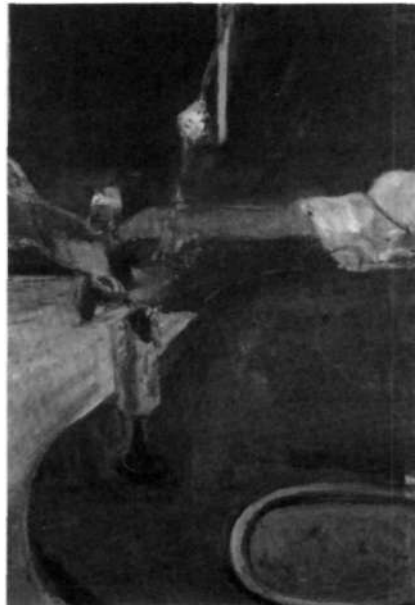
«Interior con flores», 1961.

Para Diebenkorn, un buen cuadro es aquel que se nos presenta, en primer lugar, como una combinación de partes tan íntimamente relacionadas entre sí que todas parecen tener la misma importancia hablándonos como un todo. Cuando Diebenkorn dice que el tipo de pintura que quiere hacer es «la obra total», se refiere a la coherencia de la pintura concebida como objeto, que antes significaba una caja y ahora un listón. La unidad total, relacional, que busca Diebenkorn está concebida en la superficie, pero no es independiente del objeto representado. Entre las formas de coherencia que aparecen en sus pinturas decorativas, no es la menor la cohe-