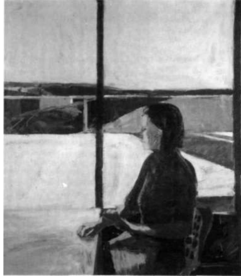
«Mujer de perfil», 1958.

Diebenkorn dice que él «siempre oscila entre la desnuda sencillez y un intento de captar lo incidental». Y que, por un lado, está el contenido que depende de los «signos, símbolos, funciones figurativas u otras gestaciones» y, por otro, el que depende de las «relaciones espaciales sin ela-