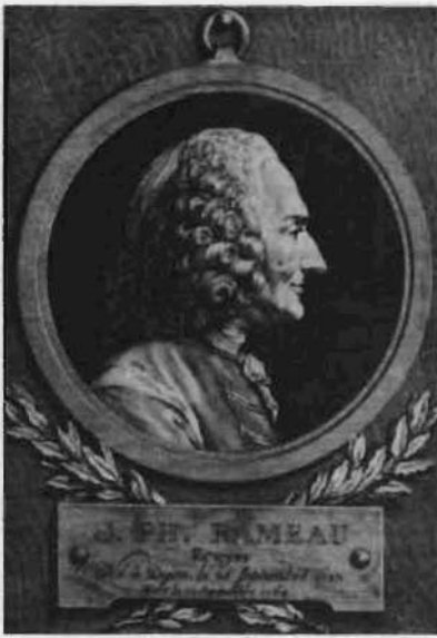
J. Ph. Rameau.

El intérprete... y el oyente, porque no es fácil entrar en este mundo refinado, hermético, íntimo, en el que ni la música ni el intérprete van a buscar al oyente a su butaca, ni mucho menos a engatusarle con el demagógico arrullo del que tanto ha abusado la historia de la música desde entonces hasta hoy. ■