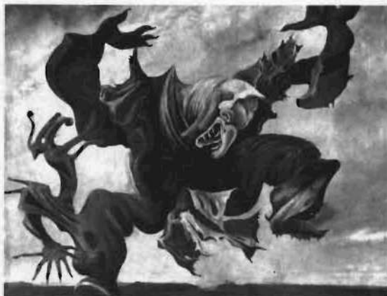
«El triunfo del Surrealismo». 1937.

En 1920 colabora con Arp y Baargeld en la serie de collages que titulan Fatagaga (FABrication de TABLEaux GARantis GAZométriques). Nace su hijo