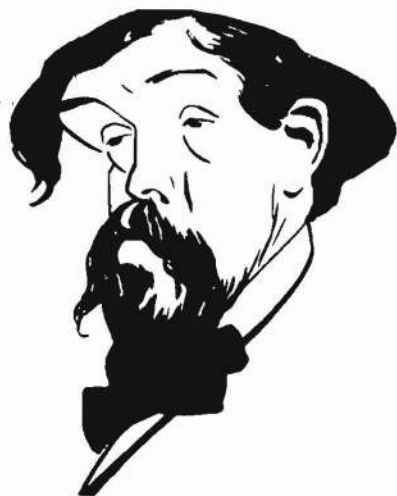
Claude Debussy.

Los profesionales de la música distinguen muy bien entre