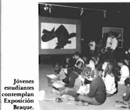
Jóvenes estudiantes contemplan Exposición Braque.