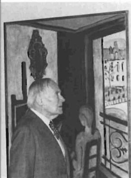
Joan Miró, ante un cuadro de la Exposición Matisse, en 1980.

Reflejar, con un criterio didáctico, las invenciones, rupturas y aportaciones más importantes que han jalonado la evolución de la escultura desde comienzos de nuestro siglo hasta la segunda guerra mundial fue el propósito de la exposición colectiva que, con el título « Medio siglo de escultura: 1900-1945 », se montó en el otoño de 1981. La integraban 123 obras de