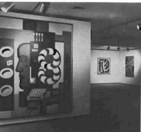
De Fernand Léger se ofreció una amplia muestra en 1983.

Tres exposiciones de fotografía han sido organizadas en la Fundación en los últimos diez años. Ofrecer una visión de conjunto del arte fotográfico en Estados Unidos y su evolución en los veinte últimos años fue el propósito de la muestra organizada en 1981 con el título « Mirrors and windows (espejos y ventanas) ». Fotografía Americana desde 1960 », con un total de 185 fotos pertenecientes a 101 artistas.