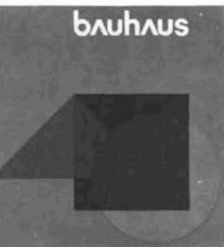
Portada del catálogo de la muestra, sobre la Bauhaus.