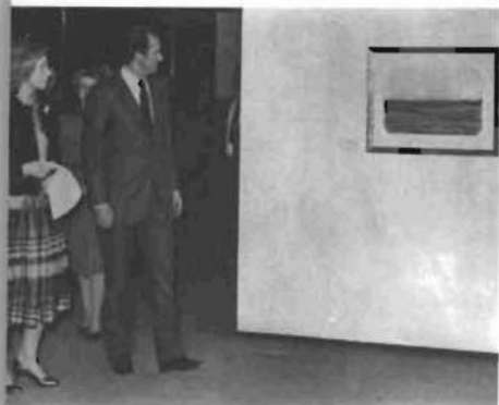
Los Reyes de España visitaron la Exposición Mondrian en 1982.