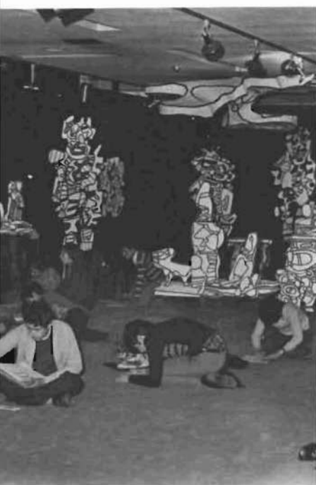
Un grupo de alumnos toma notas en la Exposición Dubuffet, exhibida en 1976.

De carácter didáctico fue la exposición de Georges BRAQUE