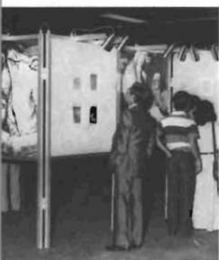
Montada en paneles desmontables, la Exposición de Grabados de Goya se presentó en Madrid en 1979.