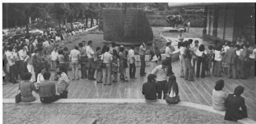
Una de las exposiciones más visitadas fue la de Picasso, en 1977.

La proyección de películas sobre su obra y su figura, durante el tiempo en que permaneció abierta la muestra, completaron la muestra, que se exhibe actualmente en Barcelona y será llevada después a otras capitales españolas.