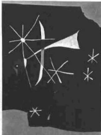
Le perroquet, de Joan Miró, de la Colección itinerante Arte Español Contemporáneo.

Con la presentación en Madrid de la Exposición «ARTE 73» (así llamada por el año de su primera exhibición) se inauguraba en enero de 1975 el nuevo edificio de la Fundación Juan March, en la calle Castelló, 77. Con esta colectiva, integrada por 81 obras de 41 artistas españoles, y ofrecida en cinco capitales españolas y cuatro europeas, iniciaba la Fundación Juan March esta tercera línea de acción de ofrecer la obra colectiva de artistas españoles de nuestros días.