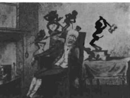
«Dolor de cabeza». Grabado de 1819, de la Exposición «Ars Medica».