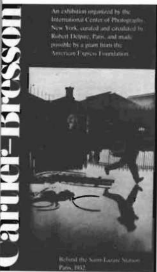
Cartel de la retrospectiva fotográfica de Cartier-Bresson.