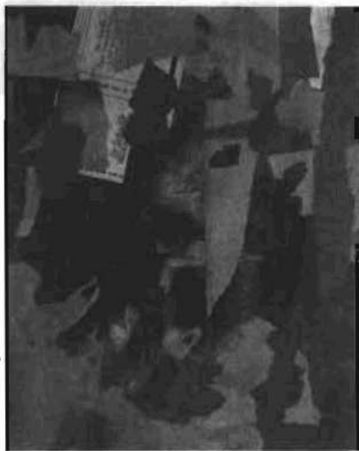
C63 Cuadro antiguo, 1946.

Con todas estas actividades Kurt Schwitters participó en muy diversos campos de la vanguardia, tanto en Alemania como en otros países. A ello hay que añadir las Matinales Merz y Veladas Merz que solía organizar con regularidad, quincenal o mensualmente, en Hanover y en otras ciudades alemanas o extranjeras. Schwitters hacía amigos en todas partes y muchos de ellos acudían a visitarle a Hanover. Vivía lleno de entusiasmo, rodeado de continuos estímulos en su mundo de relaciones personales y amistades. Así se comprenderá mejor la depresión que de-