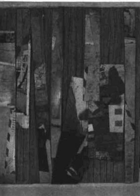
47.15 Pinos C26, 1946.

Schwitters colaboró ocasionalmente con De Stijl , donde en 1926 publicó tres poemas fonéticos, y en 1931 su último adiós al fallecido Van Doesburg. Recíprocamente aparecieron en los Cuadernos-Merz artículos de Mondrian, Van Doesburg, Huszar, Rietveld, Oud y Van Esteren. Van Doesburg tradujo al holan-