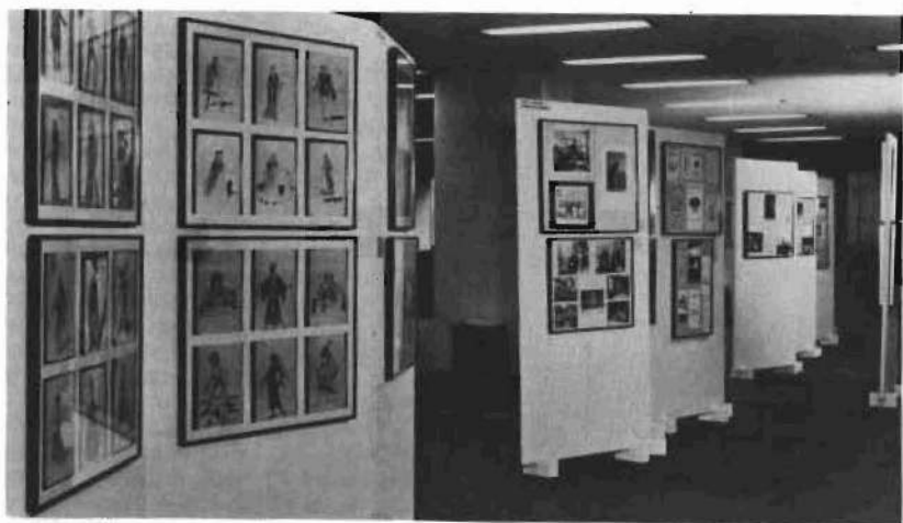
Vista parcial de la exposición documental de la Biblioteca de Teatro Español, celebrada en junio de 1981.

La biblioteca está integrada también por carteles, programas de mano de numerosas representaciones y críticas de estrenos en teatros españoles. Se ha realizado el vaciado y fichado completo, por autores, de los artículos sobre teatro español contemporáneo aparecidos en la revista «Primer Acto» y se ha elaborado todo el material de críticas teatrales publicadas en «ABC», desde su fundación como semanario, en 1903. Por otra parte, el fondo de esta biblioteca se ve continuamente engrosado por donaciones de particulares y asociaciones teatrales regionales, que envían ejemplares de obras presentadas a concursos teatrales, en su mayoría inéditas.