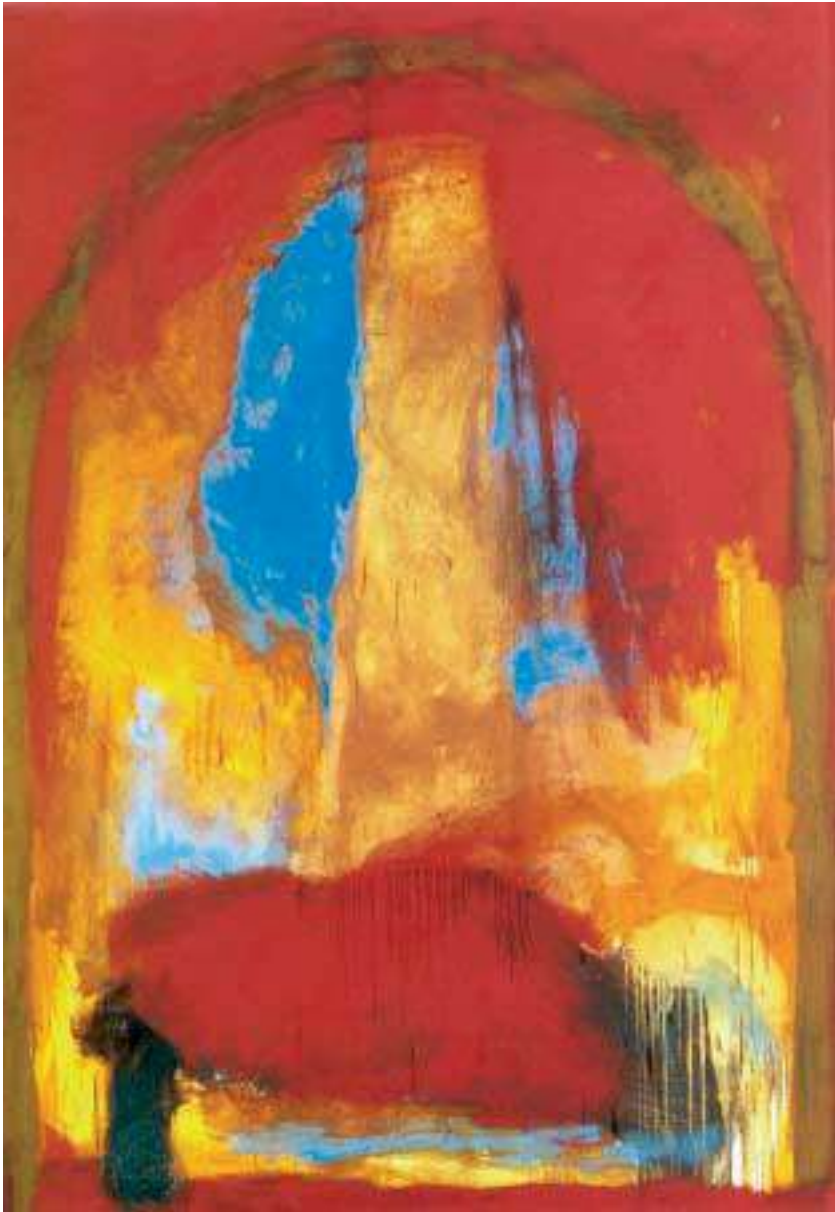
Celebración diurna, 1983 194 x 130 cm