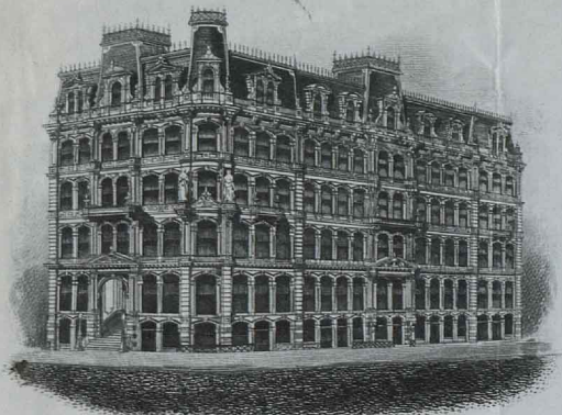
EDIFICIO KEMP, ESQUINA A LAS CALLES CEDAR Y WILLIAM.